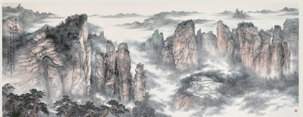
美协集体创作 《绿色张家界》