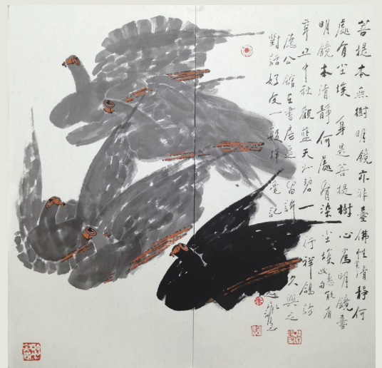
《祥鸽》 湖南省美协家协会主席 朱训德