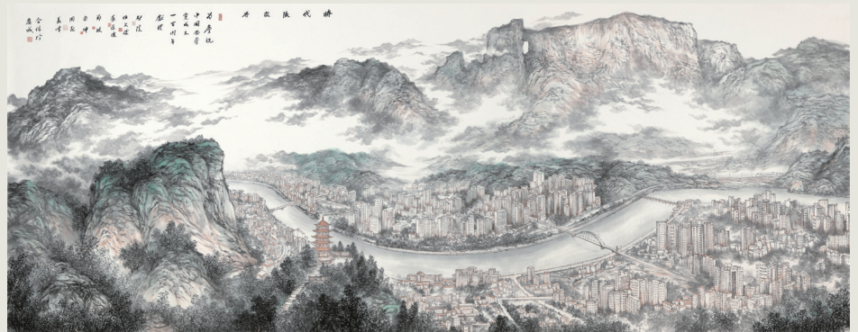
美协集体创作 《新时代张家界》