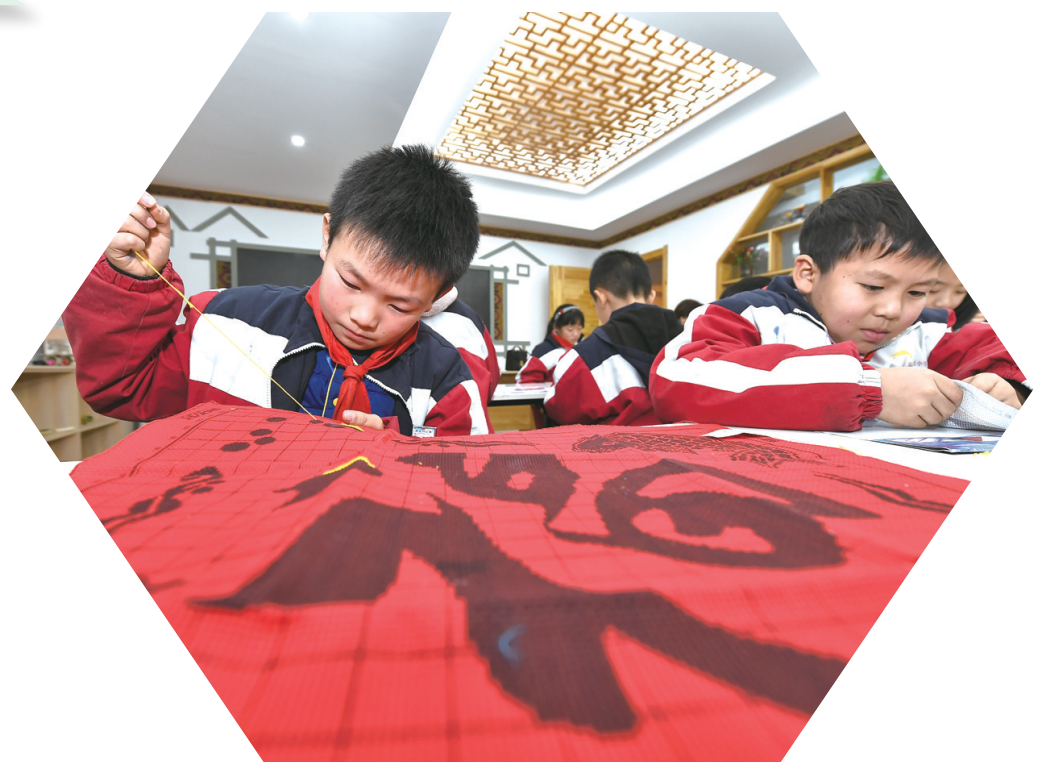
学生放学后参加兴趣班。教育改革不断丰富课后服务内容，减轻师生及家长负担。