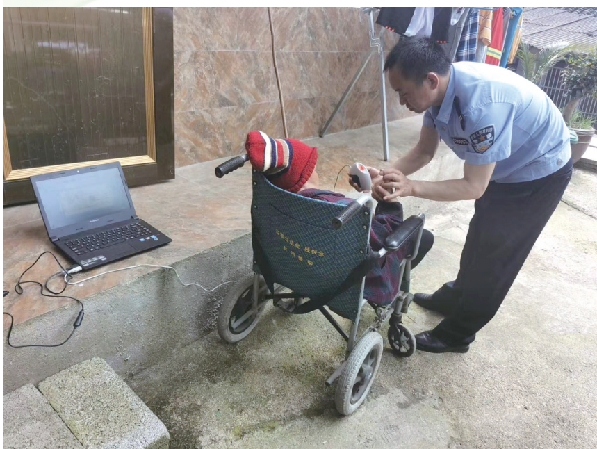
武陵源区辅警照料村里行动不便老人。一村一辅警 全覆盖，小警务 托起 大稳定。