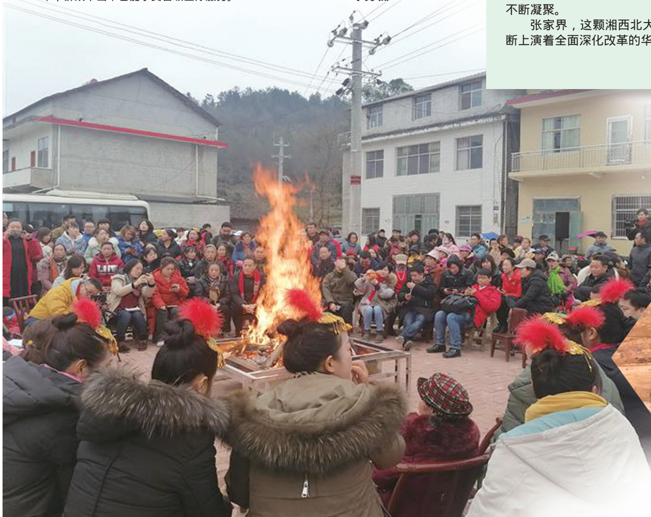
武陵源区索溪峪街道田富村屋场会。近年来，我市紧扣实际，紧盯群众需求，在住户集中的屋场院子里以农村邻里之间拉家常的方式召开会议，形成常态。这一带着浓郁乡村泥土气息的成功经验的屋场会，被誉为新时代基层治理枫桥经验的张家界样本。