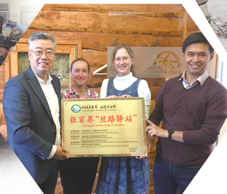
张家界 丝路驿站 落户德国首都城市柏林市。自2017年7月在哈萨克斯坦建立首家海外 丝路驿站 迄今，我市在 一带一路 沿线设立的 丝路驿站 已达22个。