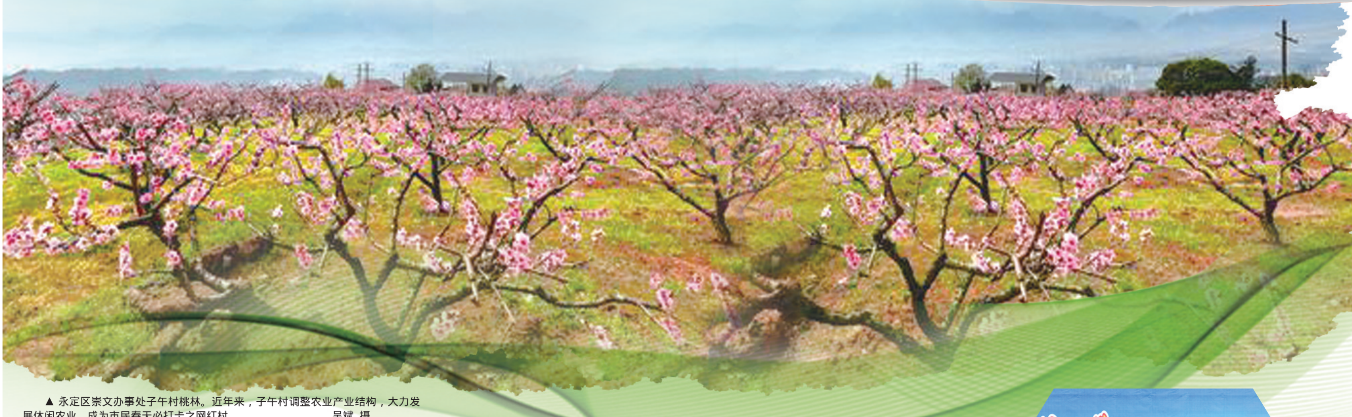
▲ 永定区崇文办事处子午村桃林。近年来，子午村调整农业产业结构，大力发展休闲农业，成为市民春天必打卡之网红村。