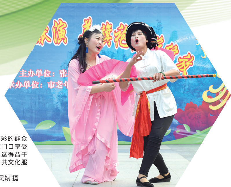
主办单位：张家界市老年大学 承办单位：市老年大学