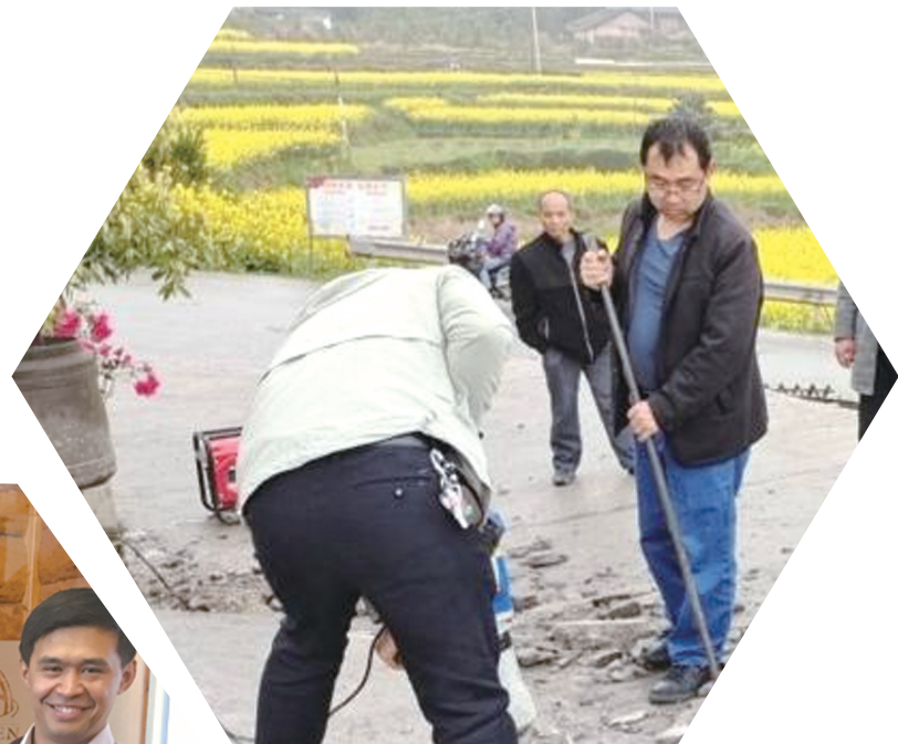
2021年3月5日，尹家溪镇马儿山村居民反映：通往岩梓八组公路，路边一户居民自行在通组公路上增设入户斜坡，影响路面通行。3月30日处理结果：尹家溪镇政府联合马儿山村已将该斜坡清除，通组公路已恢复。2019年9月3日，永定区 天门清风 微信群服务平台正式上线。各乡镇（街道）、相关区直单位及时处理回复 天门清风 微信群中的群众合理诉求。