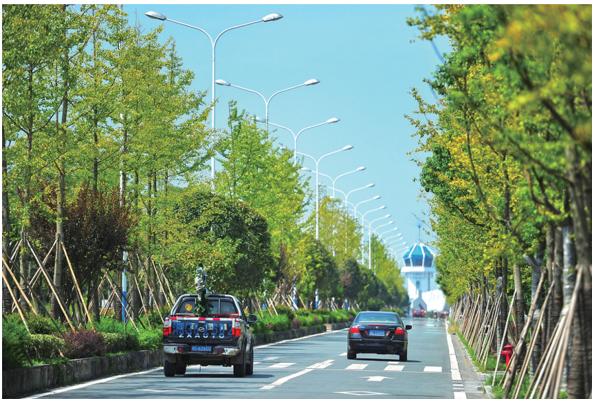
干净整洁的机场路。

躬身为民谋幸福，百姓冷暖记心间。张家界景更美了，水更绿了，居住环境更靓了，人与自然也更和谐了。无论是本地人还是外地游客，行走在宽敞顺畅的道路上，徜徉在绿意葱茏的游园，漫步在亮丽整洁的居民小区，无不魅力张家界秀美、宜居、宜游而发出啧啧赞叹。这是一幅记录岁月、与百姓同行的画卷，更是一部与时代同进的城市变迁史。