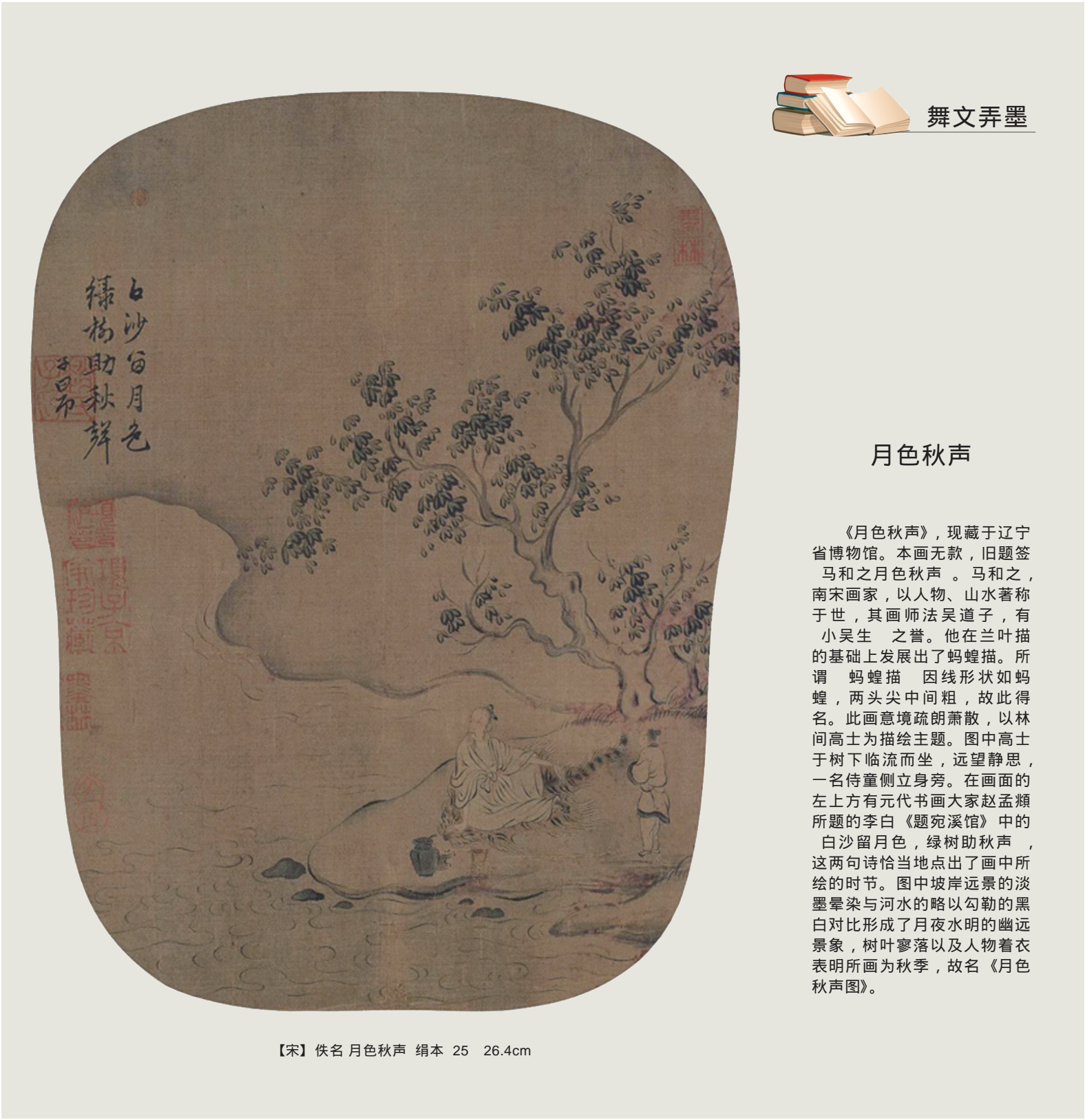
【宋】佚名 月色秋声 绢本 25 26.4cm