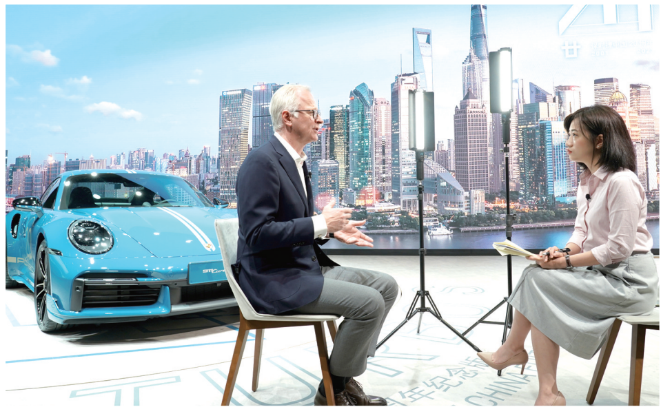
4月19日，保时捷高管在第十九届上海国际汽车工业展览会上接受采访。