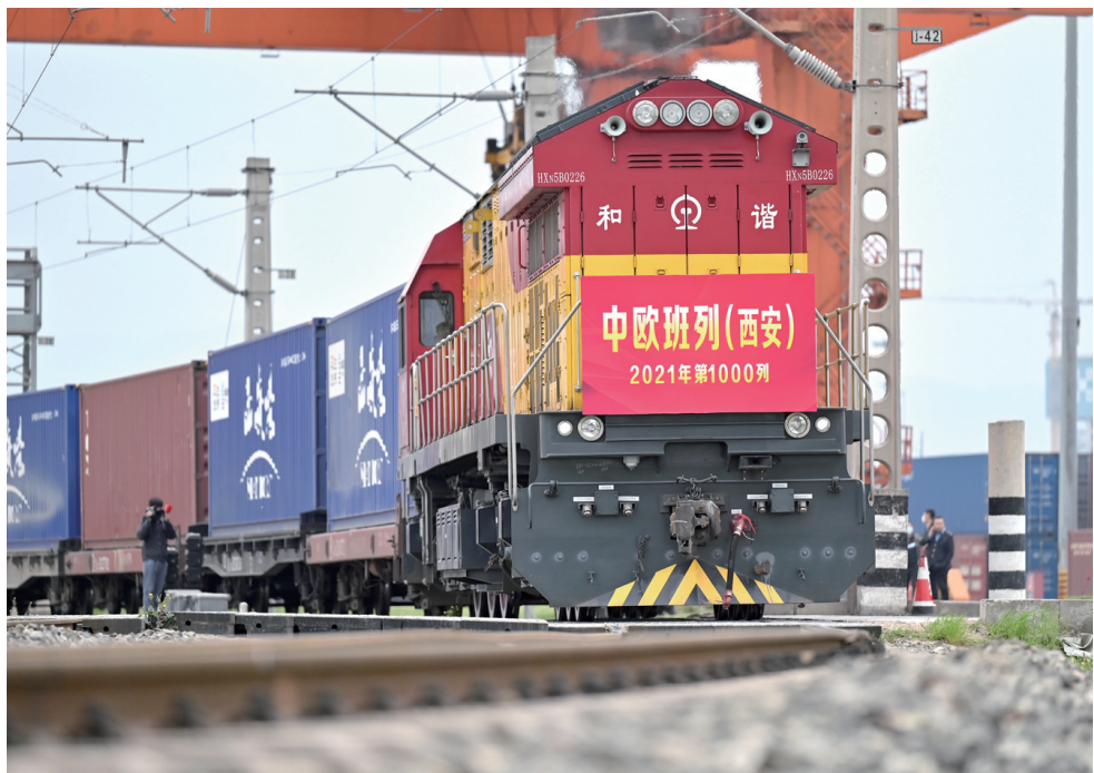
X9041次中欧班列（西安）从西安国际港站出发开往哈萨克斯坦。这是2021年陕西开行的第1000列中欧班列（4月13日摄）。