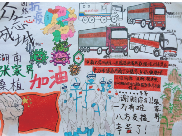
张家界加油！桑植县思源实验学校1910班 葛星宇 画