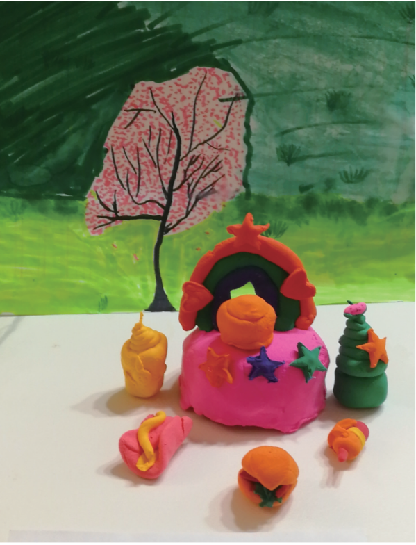
爱心抗疫套餐(手工) 张家界溧滨小学三年级7班 黄子珏 作