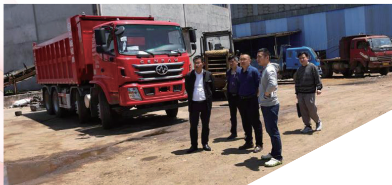
县工业园负责人调研园区企业金励矿业有限责任公司。

桑植县工业园于2009年7月经市人民政府批准设立，2012年9月经省人民政府批准为省级工业集中区。园区总控制面积为20平方公里，核心区规划控制面积7.15平方公里。园区确定了以一轴二区五组团的空间结构布局和绿色发展的总体发展定位，地跨澧源镇、利福塔、瑞塔铺三镇。现有入园企业49家，其中工业企业43家，规模以上工业企业21家，上市企业2家，高新技术产业企业16家，园区企业从业人员2300人。