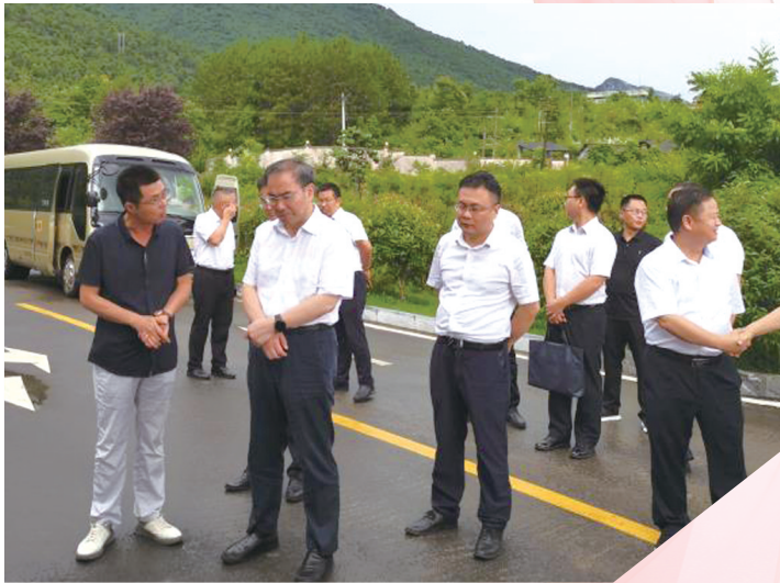
市委书记刘革安调研园区企业若谷新能源有限公司。