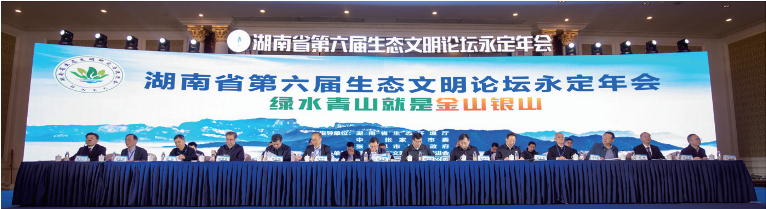
湖南省第六届生态文明论坛永定年会会场。