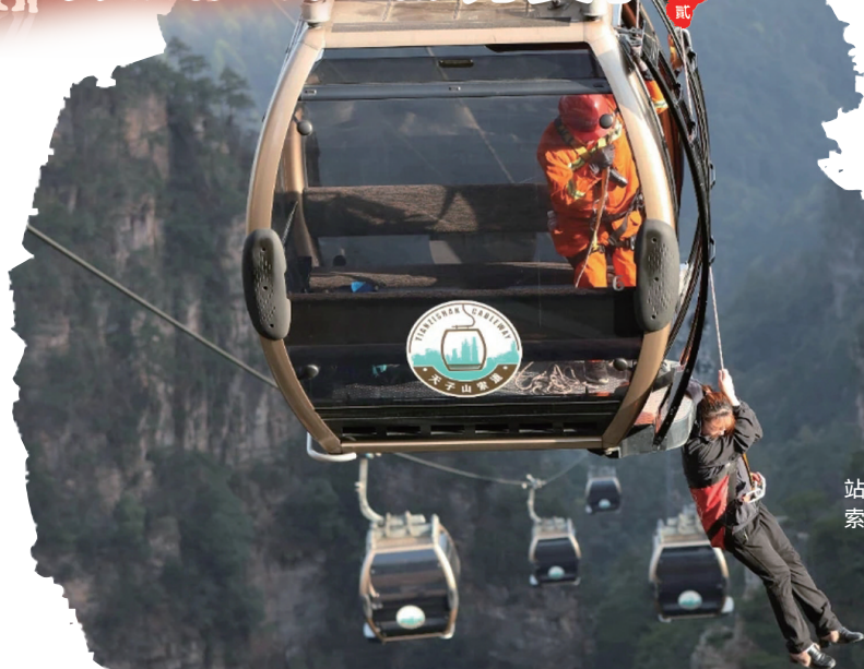
天子山消防救援站联合索道公司开展索道救援演练。