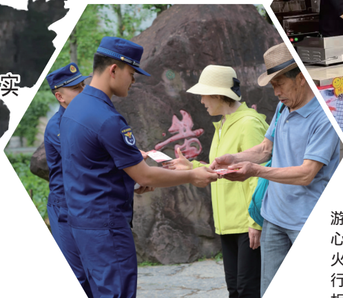
▲消防宣传服务队向景区游客进行防火宣传。