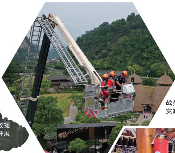
▲5月12日，消防指战员在黄龙洞开展国家防灾减灾日消防培训演练。