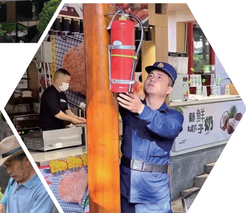
▲消防救援站队员检查景区摊棚摊点防火器材。