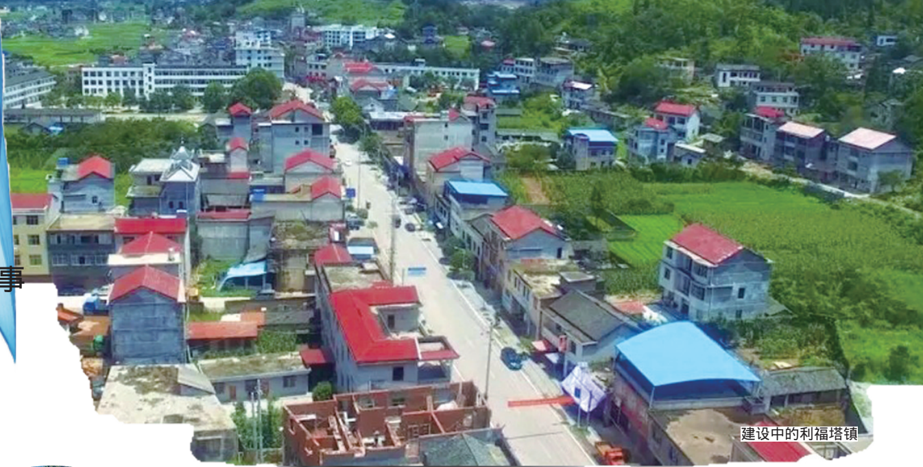
建设中的利福塔镇