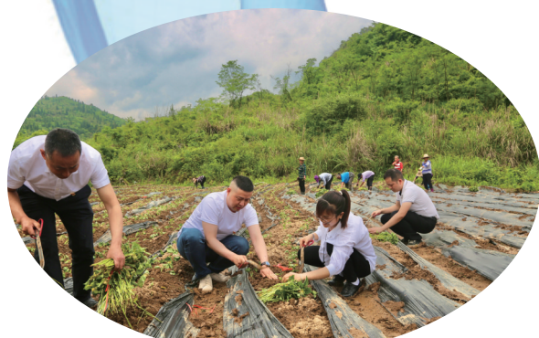
利福塔镇党员干部到小香薯产业基地同老百姓一起劳作。