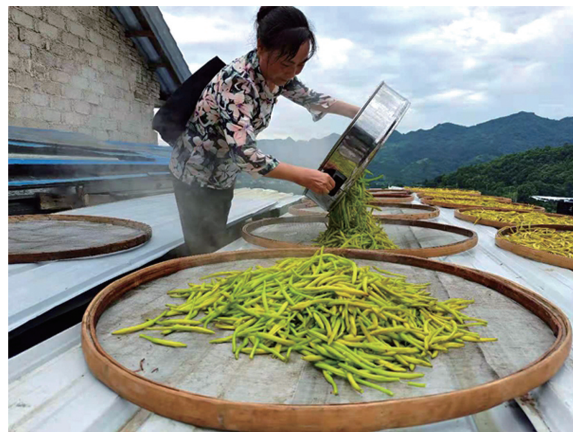
电信员工对黑蒸的黄花菜进行晾晒。

出发，采摘黄花菜去咯！7月9日早上7点半，中国电信张家界分公司（下称 张家界电信 ）及永定区分公司40多名党员，从城区出发前往西溪坪街道办事处三山村开展 党建翼联 活动。