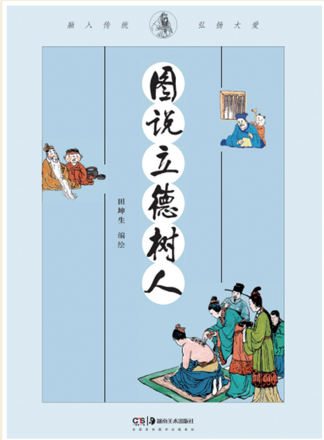
《图说立德树人》 田坤生 编绘 湖南美术出版社

形式是重要的，但我说的又不仅仅是艺术。关于 这一个，形式知道，艺术也知道；众神知道，众生也知道；繁花知道，春天也知道。