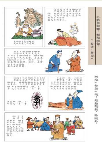
《孝敬父母》篇画面一页

《礼仪修身》部分，以漫画的艺术形式，用浪漫、生动、活泼、变形的线条刻画人物形象，直观明了，传承 衣冠文物，彰显民族精神，让读者在美的享受中不知不觉地受到熏陶。