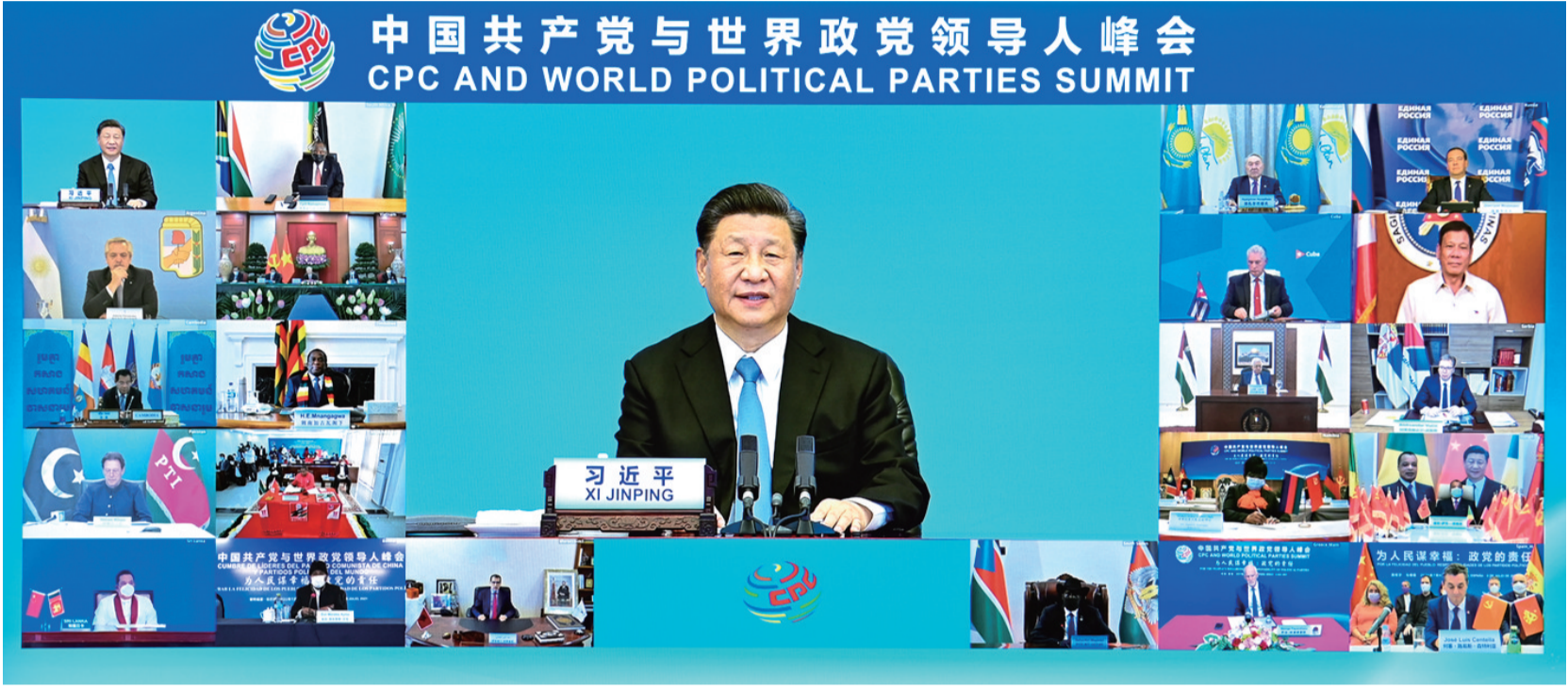
7月6日，中共中央总书记、国家主席习近平在北京出席中国共产党与世界政党领导人峰会并发表主旨讲话。

新华社北京7月6日电 中共中央总书记、国家主席习近平6日在北京以视频连线方式出席中国共产党与世界政党领导人峰会，并发表题为《加强政党合作 共谋人民幸福》的主旨讲话，强调政党作为推动人类进步的重要力量，要锚定正确的前进方向，担起为人民谋幸福、为人类谋进步的历史责任。中国共产党愿同各国政党一起努力，始终不渝做世界和平的建设者、全球发展的贡献者、国际秩序的维护者。 中国共产党与世界政党领导人峰会以“为人民谋幸福：政党的责任”为主题。峰会主会场设在人民大会堂金色大厅。金色大厅内，中国共产党党旗与参会的外国政党党旗交相辉映，呈现出壮观的党旗旗阵。会场上设置了五幅巨大的显示屏，充分展现世界各国政党领导人共聚云端、共