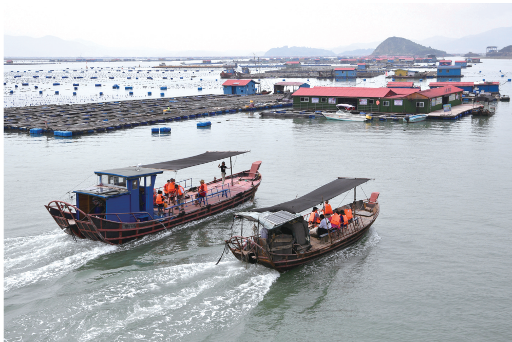
7月1日，游客乘渔船在霞浦县溪南镇海域参观。