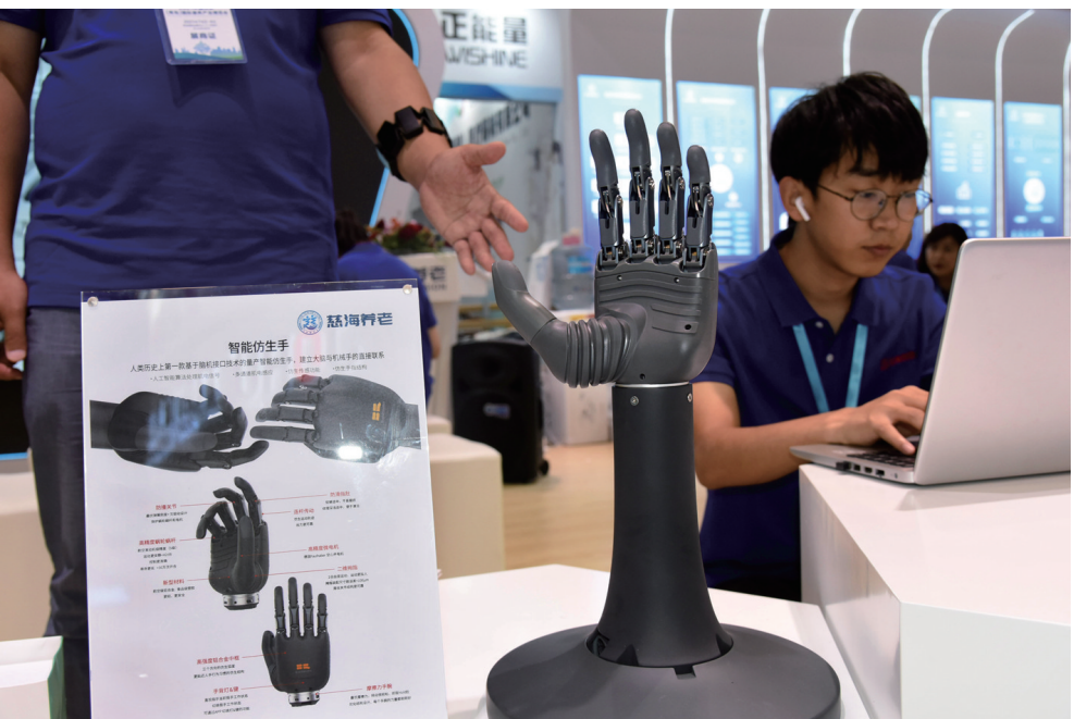
7月3日，一家参展商在展会上展示一款量产版智能仿生手。