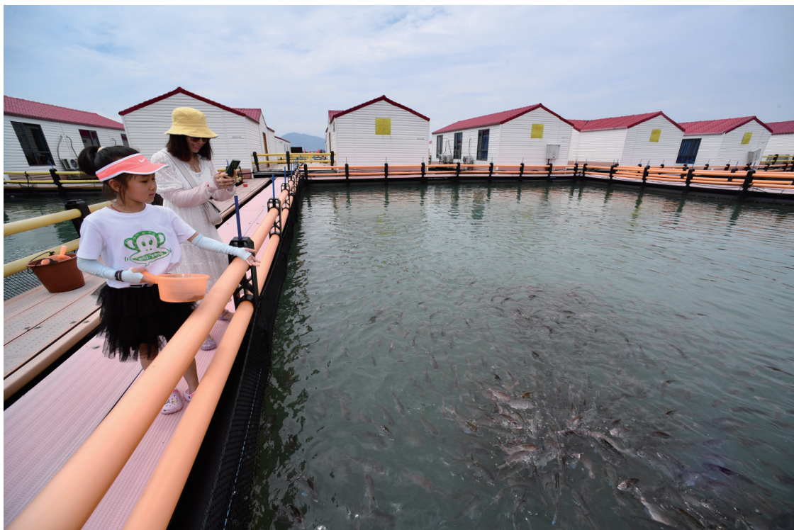
7月1日，在霞浦县溪南镇七星海域深水网箱养殖区，游客在喂食网箱内的海鱼。