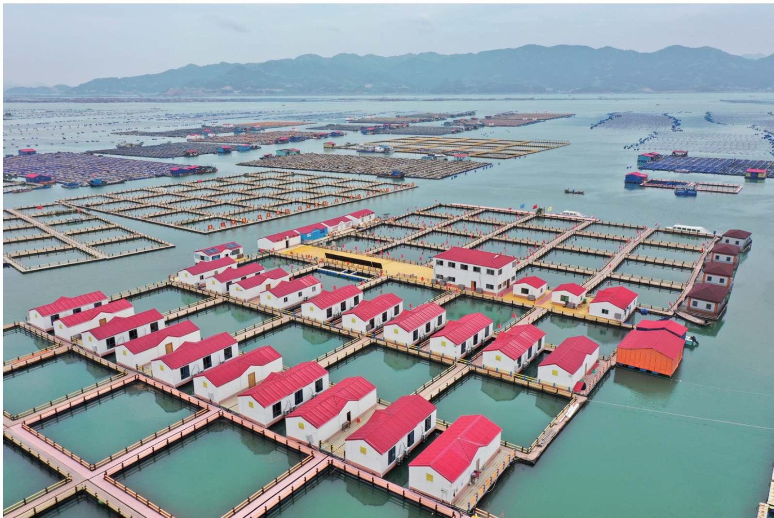
这是7月1日拍摄的霞浦县溪南镇七星海域深水网箱养殖区内的渔排民宿（无人机照片）。