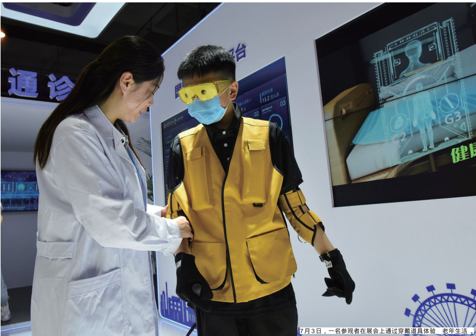
7月3日，一名参观者在展会上通过穿戴道具体验老年生活。