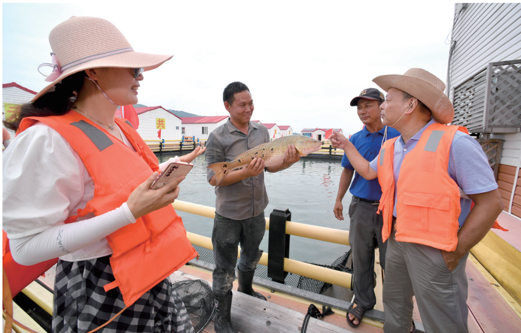
7月1日，在霞浦县溪南镇七星海域深水网箱养殖区，养殖户（左二）在向游客展示饲养的海鱼。