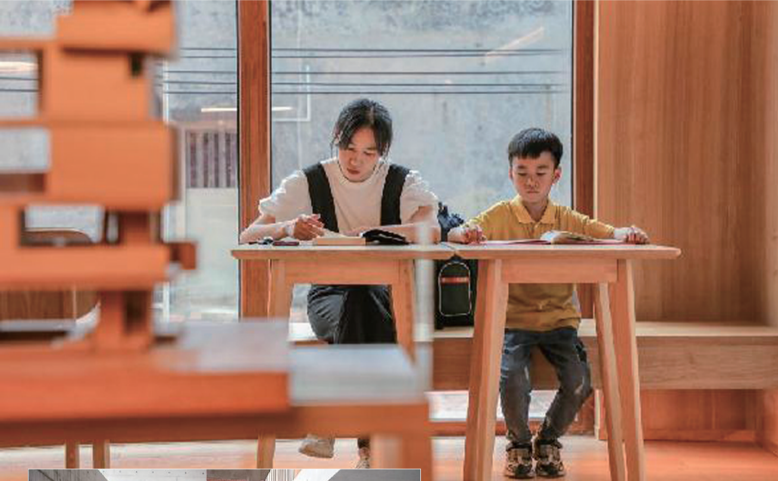
一对母子在福建省晋江市东石镇 母亲的房子 图书馆内阅读。