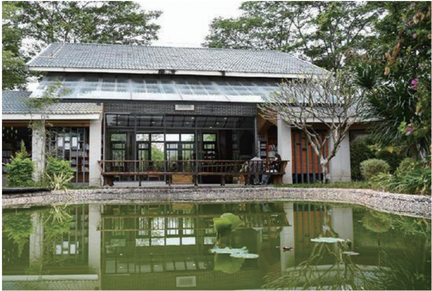
书院一角。