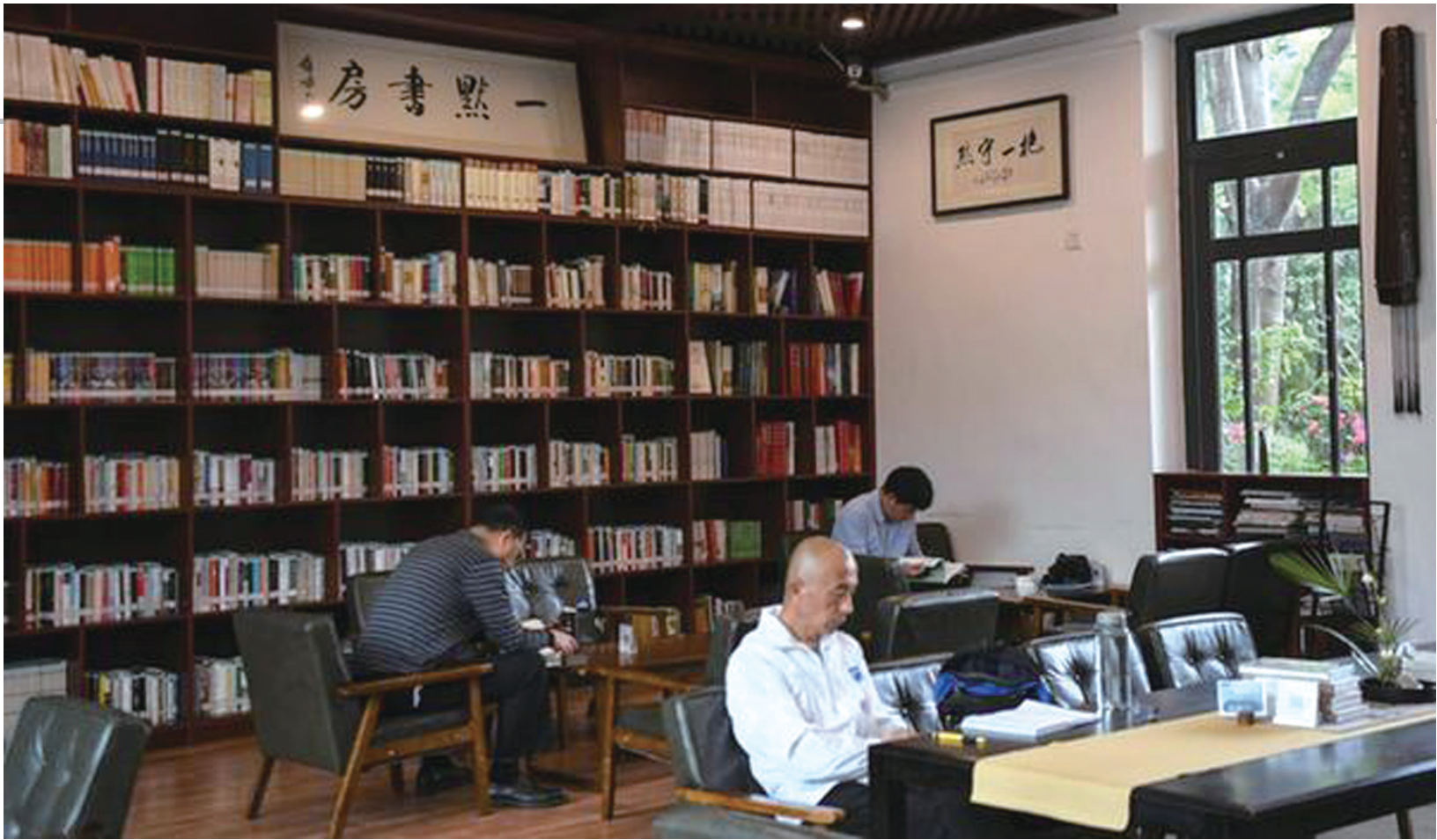
市民在岛上书院内阅读。