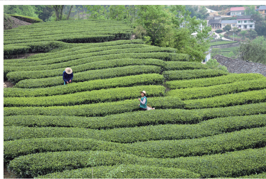
时下正是春茶采摘期，图为3月20日慈利三合口村民在茶叶基地采茶。