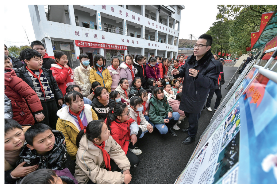
3月11日，永定区人民检察院在三坪小学开展 关爱留守儿童、播撒法治种子 主题活动，向学生们普及法律法规，引导学生们树立法治理念。