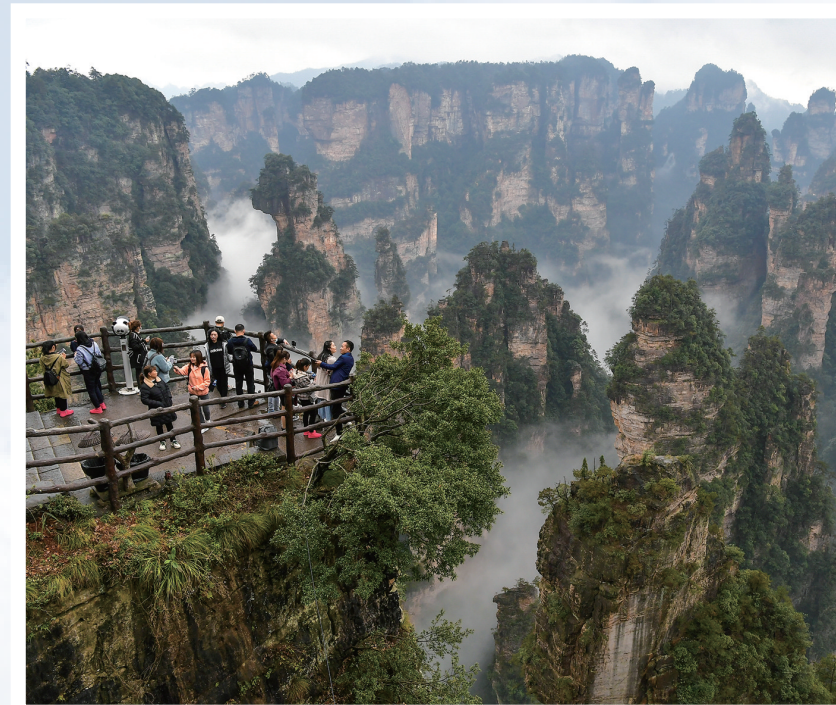
3月19日，游客在武陵源核心景区观光游览。据了解，入春以来，核心景区旅游强劲复苏，目前每天接待一次进山游客量在1万人左右。