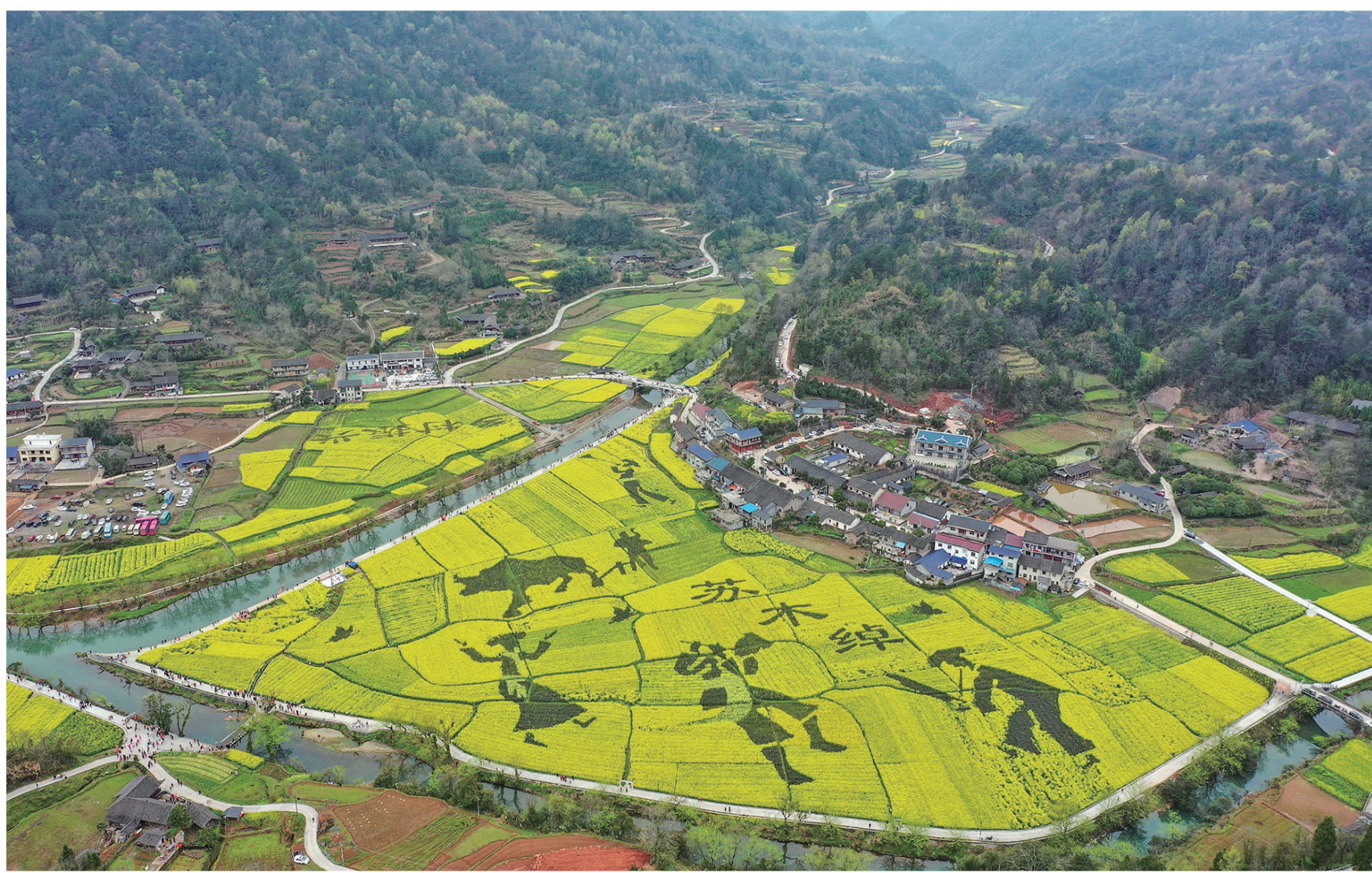
3月14日，永定区沅古坪镇红土坪 栗子坪油菜花海吸引众多市民和游客前往观赏游览。近年来，永定区结合美丽乡村建设，对村域旅游资源、生态环境、基础设施等进行优化提升，打造了多处乡村美景。