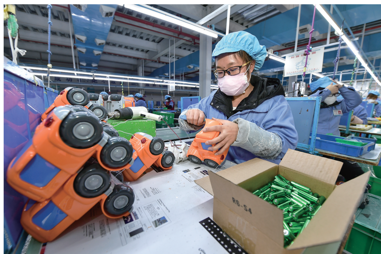
张家界占生塑胶制品有限公司工作人员在车间内进行生产作业。