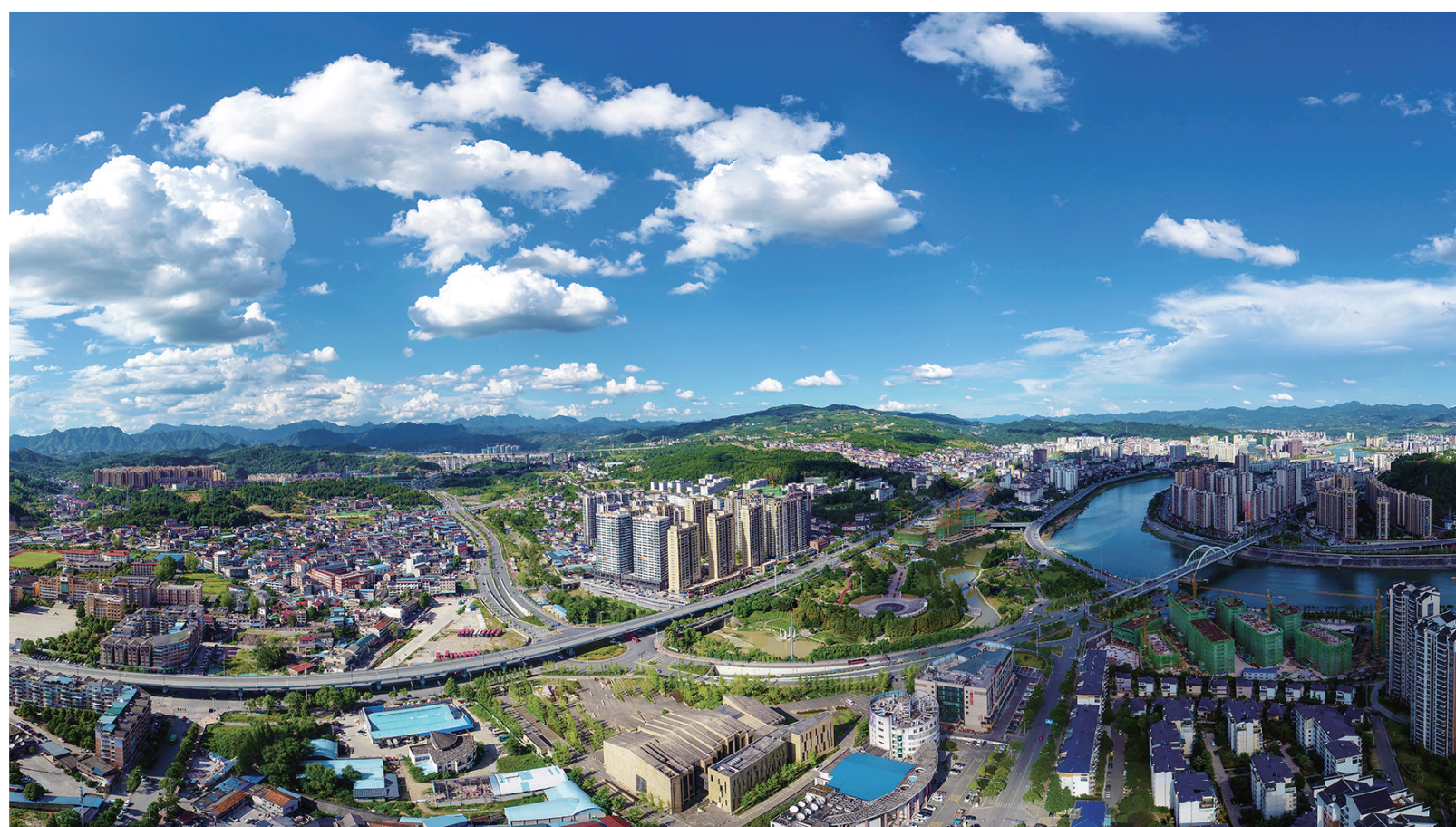
蓬勃发展的市中心城区。