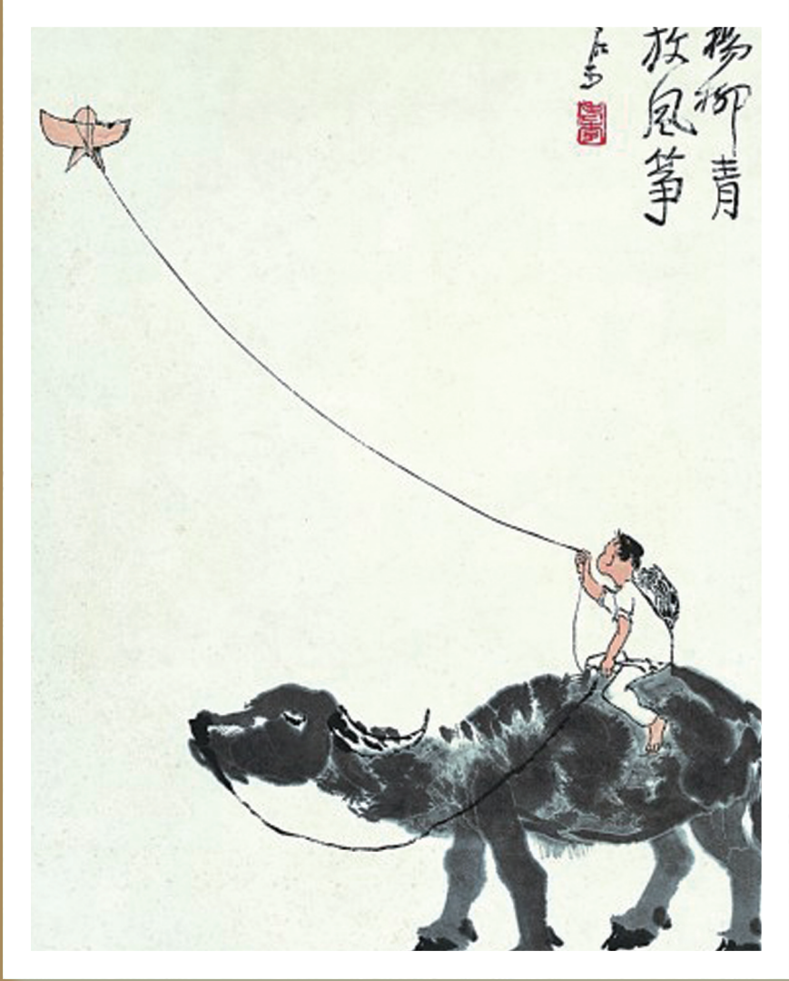
《杨柳青 放风筝》李可染 作