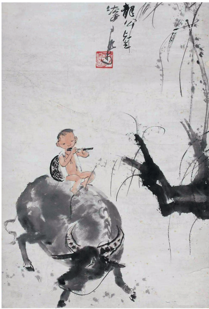
李可染《牧童牛背吹笛图轴》辽宁省博物馆馆藏