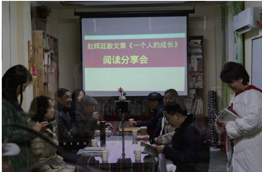
武陵源区文友进行《一个人的成长》阅读分享会