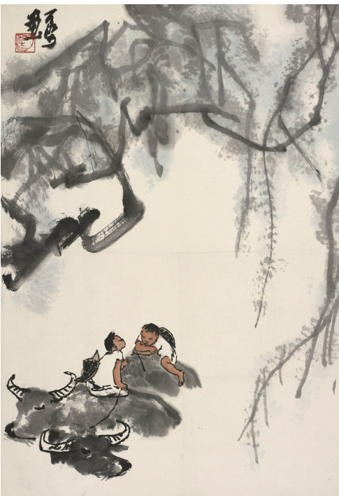
李可染笔下的水牛和牧童

如车，社酒陶陶夜到家。村中无虎豚犬闹，平垌小径饶桑麻。也无汉书挂牛角，聊挂一壶村醪薄。南山白石不必歌，功名富贵如予何。