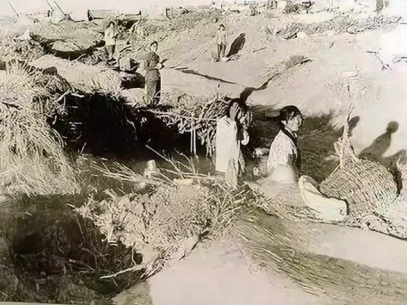
▲八千湘女进疆之初,就住在这样的地窝子里,结婚成家,生儿育女。

持一种灵活性,将弱音清晰地传达到听者心灵;异常出色的连音技巧又使她具有随心所欲地支撑音乐幅度、拉出连绵悠长的旋律线的能力。人们用耳朵可以 看 见这首歌中湘女的形象,用眼睛可以 听 见湘女的故事。最后男歌手以高音切入,极致地营造出荡气回肠的苍凉感。