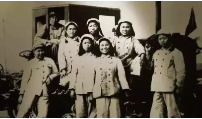
▲新疆建设兵团第一代女拖拉机手。