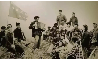
▲生产间隙,湘女们的歌声驱走了荒原的寂寞。