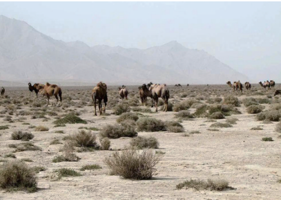
▲天山脚下的戈壁滩。