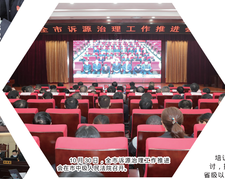
10月30日，全市诉源治理工作推进会在市中级人民法院召开。