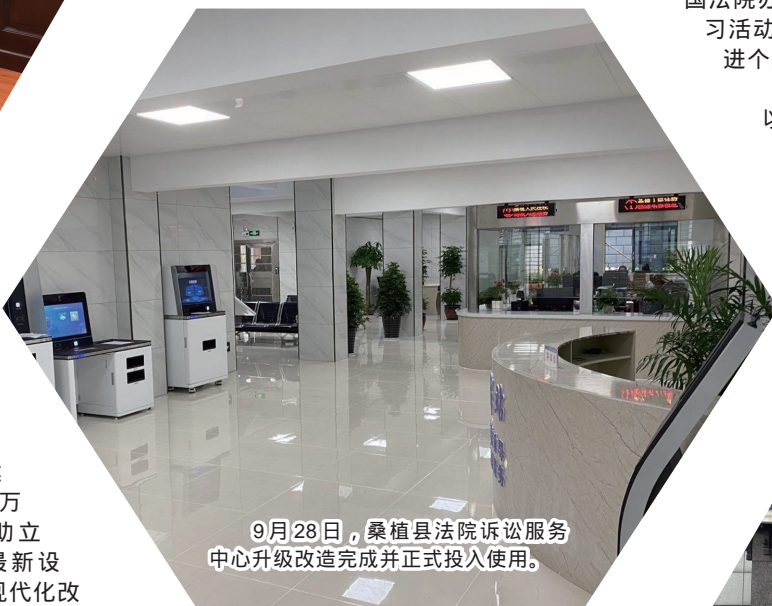
9月28日，桑植县法院诉讼服务中心升级改造完成并正式投入使用。