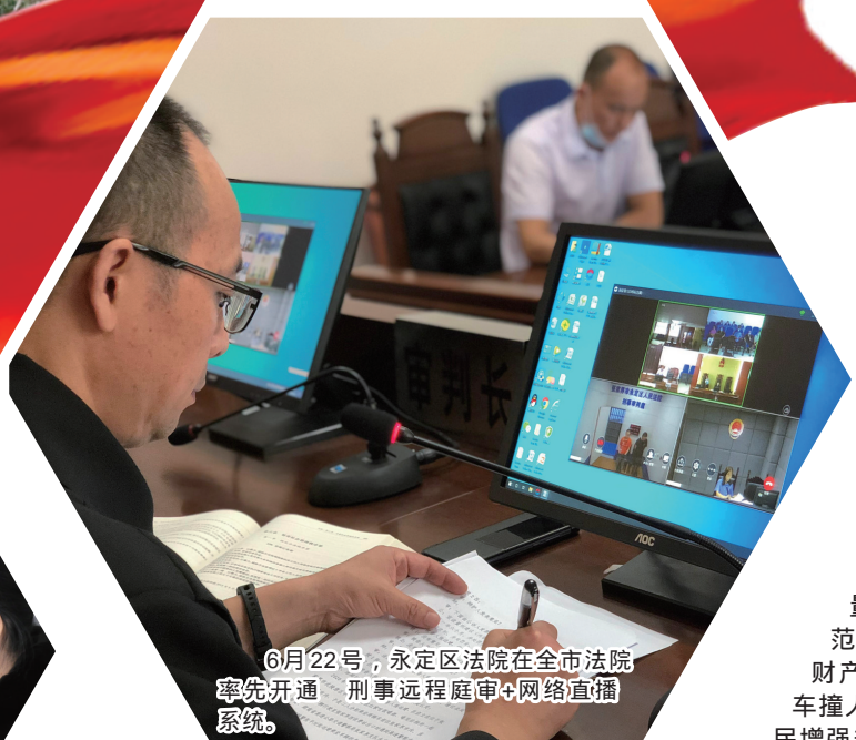
6月22日，永定区法院在全市法院率先开通“刑事远程庭审+网络直播”系统。