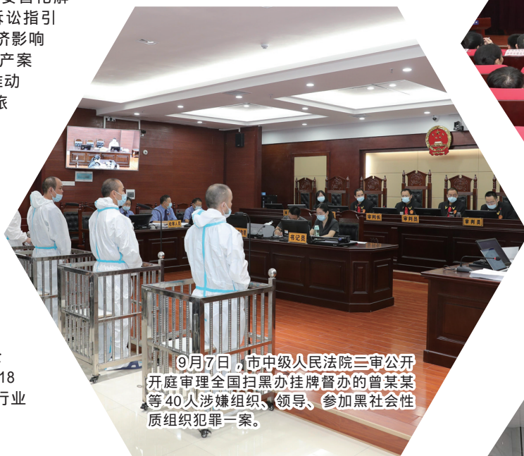
9月7日，市中级人民法院三审公开开庭审理全国扫黑挂牌督办的曾某某等40人涉嫌组织、领导、参加黑社会性质组织犯罪一案。