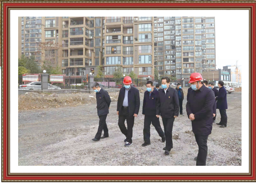
市委书记戴正贵视察城建工程