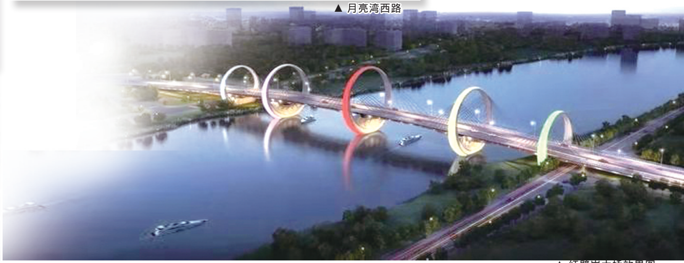
▲红壁岩大桥效果图