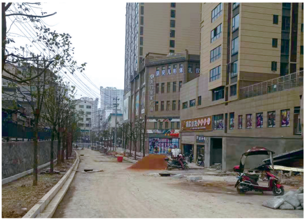
▲城墙路一期（航院段）