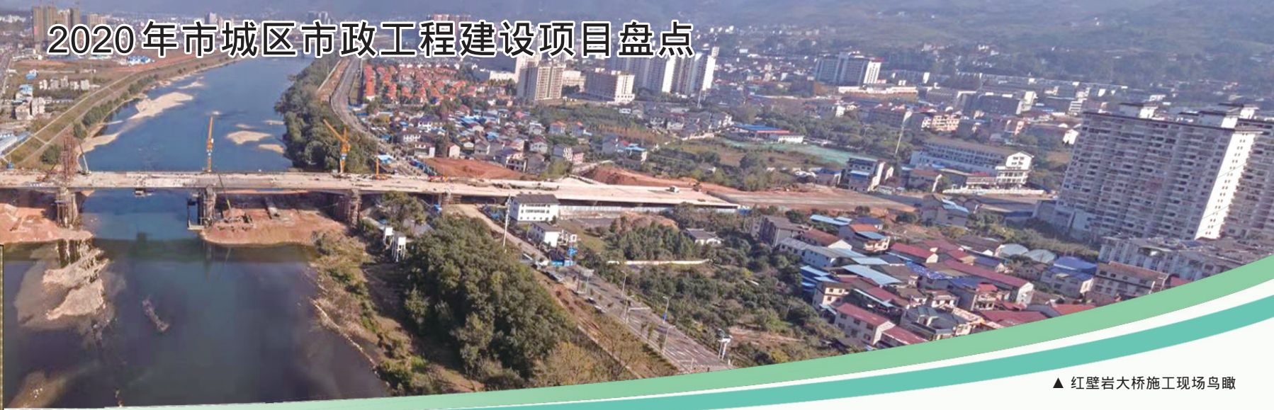
▲红壁岩大桥施工现场鸟瞰