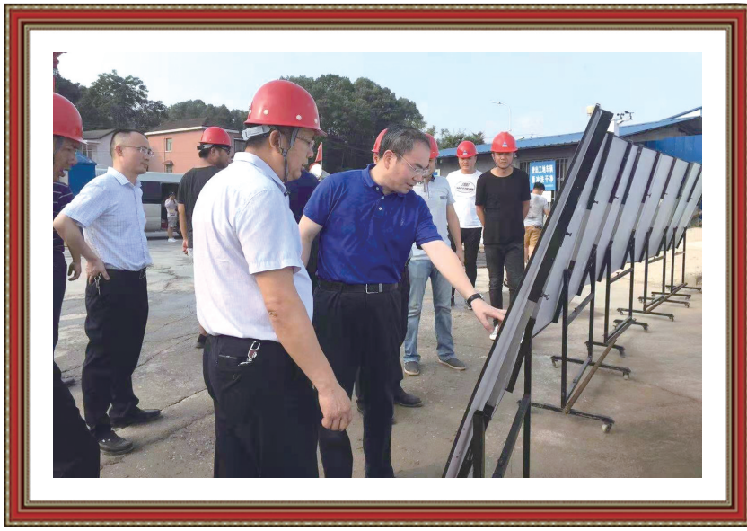
市长刘革安观看工程展板

2020年，在克服疫情影响、财政资金紧张、建设资金不足及土地报批指标等困难和压力下，市住建局积极推进市政项目复工复产，狠抓项目建设程序到位，安全生产，文明施工，为加快张家界市城市建设步伐，创建国家文明卫生城市作出了突出贡献。2020年，全市住建系统负责实施的市政项目有43个，概算投资88.56亿元，年度计划投资39.2亿元。1-12月，开工28个，开工率65%；完成投资27.5亿元，占年度计划的70%。