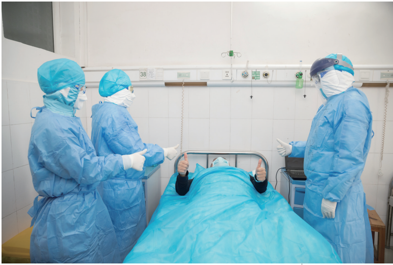
新冠肺炎患者治愈后，点赞医护人员。