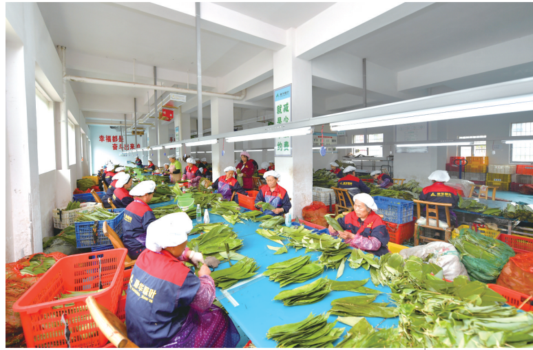
桑植县扶贫车间里，工人们正在挑选、扎捆粽叶。

疫情袭来，我市迅速行动，严防死守，奋力阻击疫情蔓延。疫情形势好转后，我市主动出击，一手抓疫情防控，一手抓复工复产，抗疫斗争取得重大胜利。