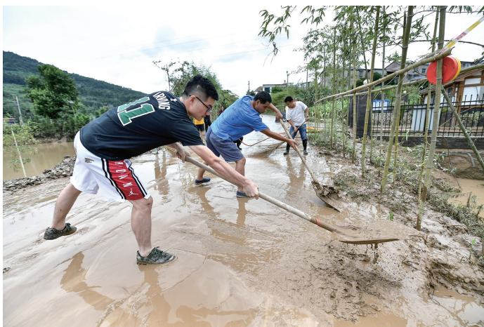
7月19日，党员干部清扫道路淤泥。邵颖 摄

主汛期期间，历时56天、连续13轮、历史罕见的高频次强降雨接踵而至。全市上下众志成城，筑起抗洪救灾战斗堡垒，党政机关连续5周取消双休，4万余名党员干部日夜巡堤巡坝巡库巡点，成功处置重大险情39起，累计帮助转移安置群众10.45万人次，实现了“不垮一堤一坝、不因灾死亡一人”的目标。