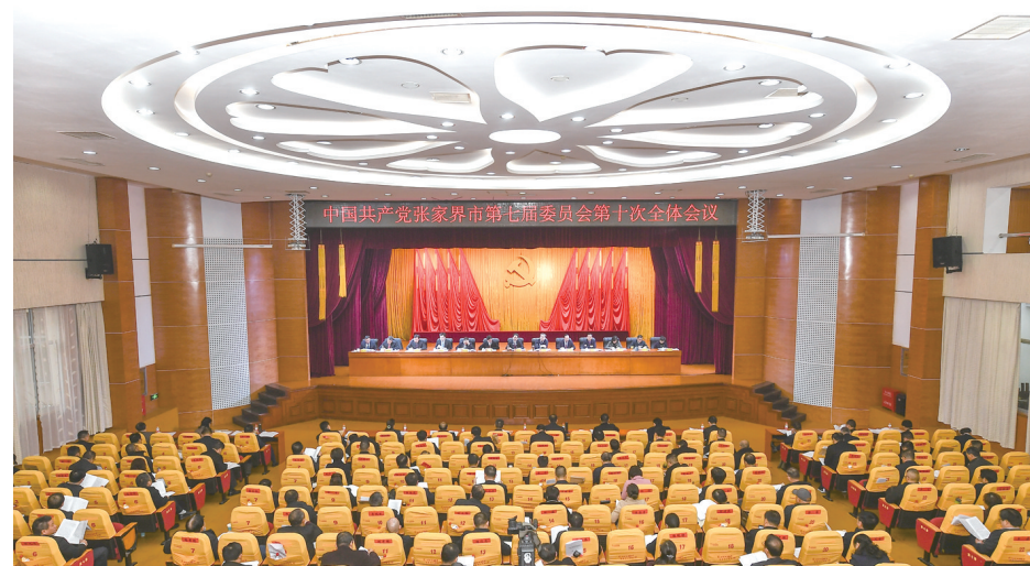
12月11日，市委七届十次全会召开。邵颖 摄

12月11日，市委七届十次全会为“十四五”谋篇布局：打造世界一流旅游目的地、武陵山片区改革开放新高地；打造国家生态文明建设示范区、国家特殊类型地区振兴示范区；打造“锦绣潇湘”全域旅游基地龙头；打造人民幸福美好家园。