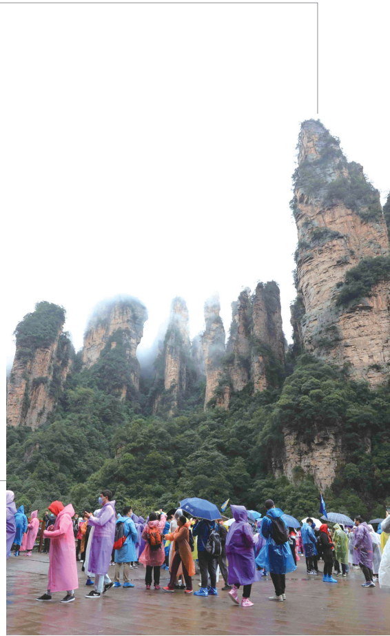
武陵源景区游人如织。

因疫情遭受重创的张家界旅游业按下重启键。2月18日，我市实施促进旅游市场全面复苏310行动计划，成为湖南首个系统推出促进旅游市场全面复苏计划的市州。我市旅游市场恢复到去年的六成，成为全国同类山岳型景区旅游恢复进度最快的地区。