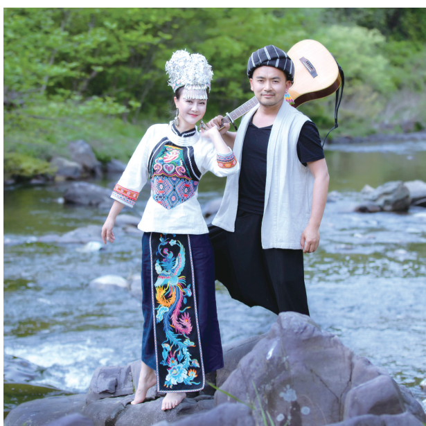
山水组合演唱《你莫走》。

4月29日，张家界山野民谣《你莫走》全网上线，迅速点燃网民激情，至2020年底，网络综合点击量超过百亿次。在《你莫走》的催化下，我市文旅网络营销百花齐放，形成了网红经济“张家界现象”。