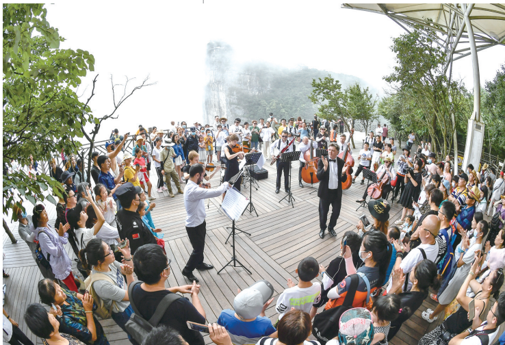
张家界爱乐乐团在天门山景区演奏。

2020年初，乌克兰著名指挥家、张家界爱乐乐团常任指挥库琴科·塔拉斯和乐团的20多位乌克兰音乐人创作抗疫歌曲《相信》，传诵到乌克兰乃至全球，展示张家界抗疫的深沉力量。我市参与联合摄制的全国脱贫攻坚重点电视剧《江山如此多娇》在我市顺利杀青，即将在2021年元月热播；10月22日，我市两作品获“梦圆2020”脱贫攻坚主题文学创作一等奖；11月16日至22日，中国·张家界首届世界遗产摄影大展在我市举办；12月9日至11日，仙境张家界诗约全世界中国·张家界第四届国际旅游诗歌节举行……2020年，我市厚植文化，以丰富多彩的形式讲好张家界故事。