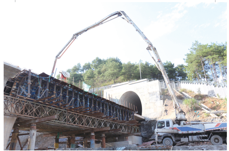
10月13日，张吉怀铁路2标张家界段最后一跨现浇梁顺利浇筑。

3月31日，市应对新冠肺炎疫情促进经济高质量发展工作指挥部发布第1号令《关于设立影响经济社会高质量发展投诉举报方式的通告》，坚持“随叫随到，不叫不到，服务周到，说到做到”，为项目建设和经济高质量发展提供“保姆式”服务。之后，全市项目建设快马加鞭，铺排重点项目171个，141个实施项目开（复）工132个，完成投资285亿元。