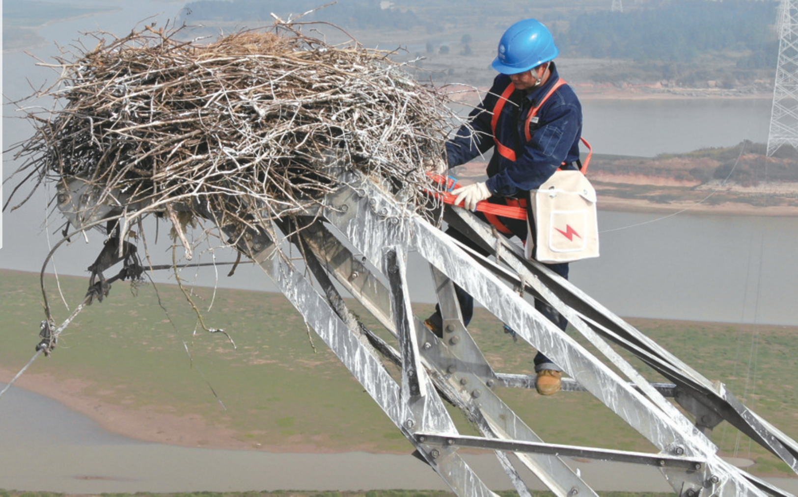
电力工人爬上铁塔加固鸟巢（12月12日摄）。

随着天气转冷，大批候鸟飞抵鄱阳湖。因为东方白鹤习惯飞回旧巢，电力部门为了保障输电设施安全给这座铁塔安装了防鸟粪设备，还专门安排工人上塔对鸟巢进行加固，既保供电又保候鸟。