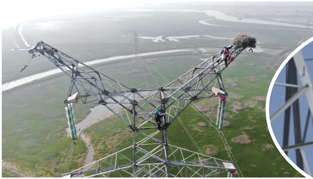
电力工人爬上铁塔加固鸟巢（12月12日摄，无人机照片）。