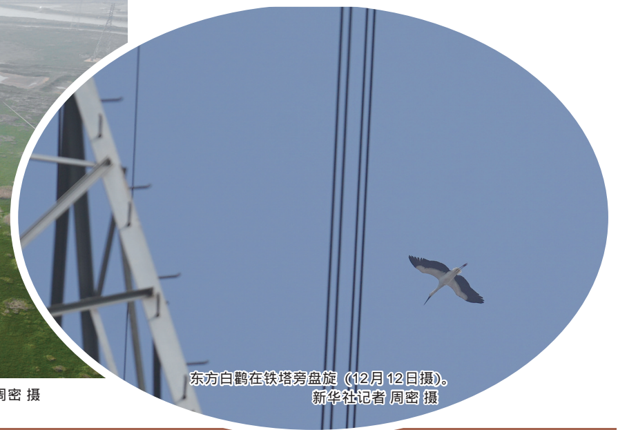
东方白鹤在铁塔旁盘旋（12月12日摄）。