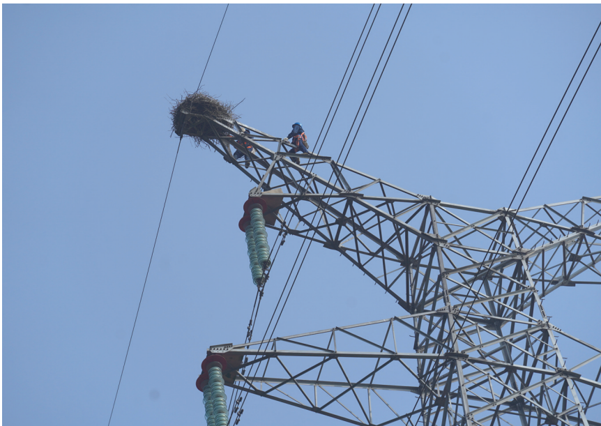
电力工人爬上铁塔加固鸟巢（12月12日摄）。