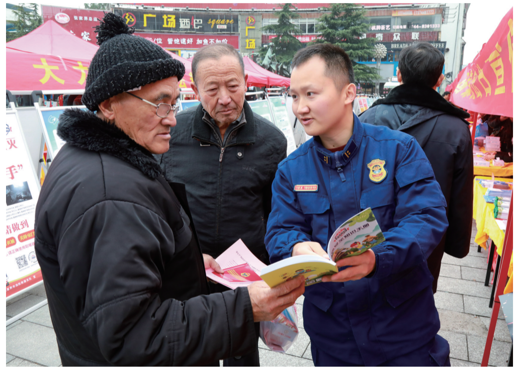
12月4日，市消防救援支队以我市举办的国家宪法日集中宣传活动为契机，开展了形式多样的消防安全知识宣传活动，全面普及消防法律法规常识，掀起了冬季防火的宣传热潮。

向周围房间蔓延。了解情况后，现场指挥员果断下达作战命令，经过20分钟的紧张扑救，火势被完全控制。据了解，此次火灾是由于房屋主人在杂物间熏制腊肉所致。在此，消防部门提醒广大村民：年关将近，熏制腊肉时一定要增强消防安全意识，远离易燃物，确保有人看守，做到人走火熄，以免酿成火灾。（魏咏柏）