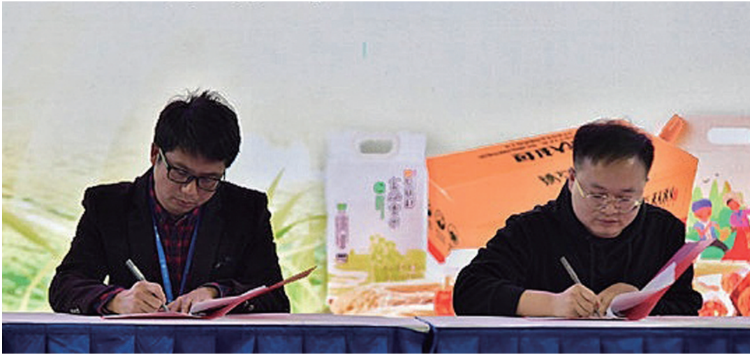
推介会现场举行 硒有慈利 购销签约仪式。