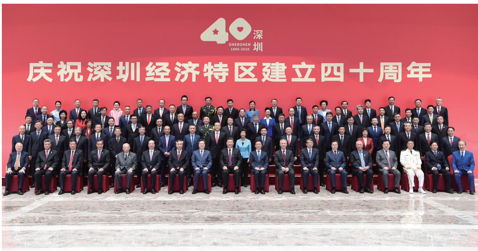
10月14日，深圳经济特区建立40周年庆祝大会在广东省深圳市隆重举行。中共中央总书记、国家主席、中央军委主席习近平在会上发表重要讲话。这是习近平等亲切会见参加庆祝大会的部分代表并同大家合影留念。

新华社深圳10月14日电 深圳经济特区建立40周年庆祝大会14日上午在广东省深圳市隆重举行。中共中央总书记、国家主席、中央军委主席习近平在会上发表重要讲话强调，要高举中国特色社会主义伟大旗帜，统筹推进五位一体总体布局，协调推进四个全面战略布局，从我国进入新发展阶段大局出发，落实新发展理念，紧扣推动高质量发展、构建新发展格局，以一往无前的奋斗姿态、风雨无阻的精神状态，改革不停顿，开放不止步，在更高起点上推进改革开放，推动经济特区工作开创新局面，为全面建设社会主义现代化国家、实现第二个百年奋斗目标作出新的更大的贡献。