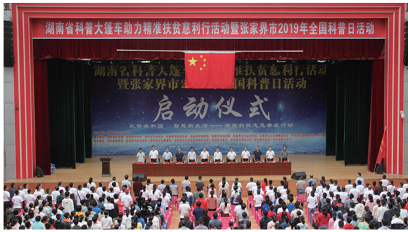
全国科普日活动现场

2018年，中国工程院院士宋湛谦及其团队入驻张家界仙踪林农业科技开发有限公司，建立全市首家湖南省院士专家工作站，并与华中科技大学共建研究生实践育人基地，搭建名校+名城人才交流沟通桥梁。院士专家加盟使我市服务科技人才平台进一步拓宽。值得一提的是，2020年市科协成功申报湖南科技论坛及院士专家市州行项目，这也为加强学术交流，推动全市创新驱动发展注入新动力。