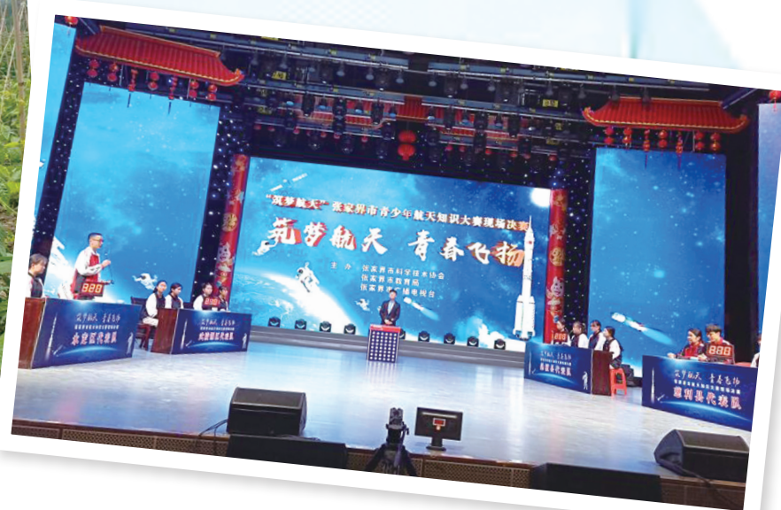
市青少年航天知识大赛现场