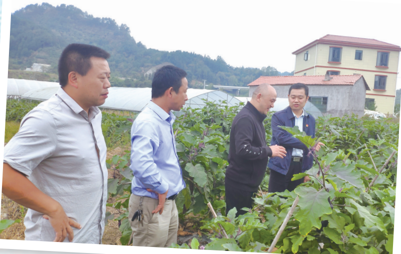
市科协工作人员到科普基地调研

新成效、新格局、新作为。这是全市科协系统同心协力、开拓进取的结果，也是全市广大科技工作者凝聚共识、团结奋斗的结果。党的十九大描绘了中国特色社会主义新时代的宏伟蓝图，开启了建设世界科技强国和社会主义现代化国家的新征程，为科技工作者提供了施展抱负的广阔舞台，为科协组织提供了无比广阔的发展空间。新的形势和任务，全市广大科技工作者和各级科协组织将坚持凝聚智慧和力量，服务科技创新驱动发展，努力开启新时代全市科协工作新局面，为全市经济社会高质量发展贡献新的力量。