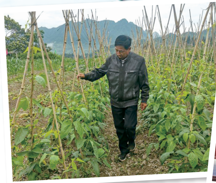
老科技工作者开展技术指导