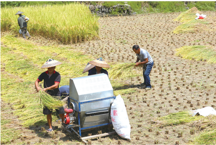
8月28日，吉首市乾州街道西门口村，村民在收获水稻。