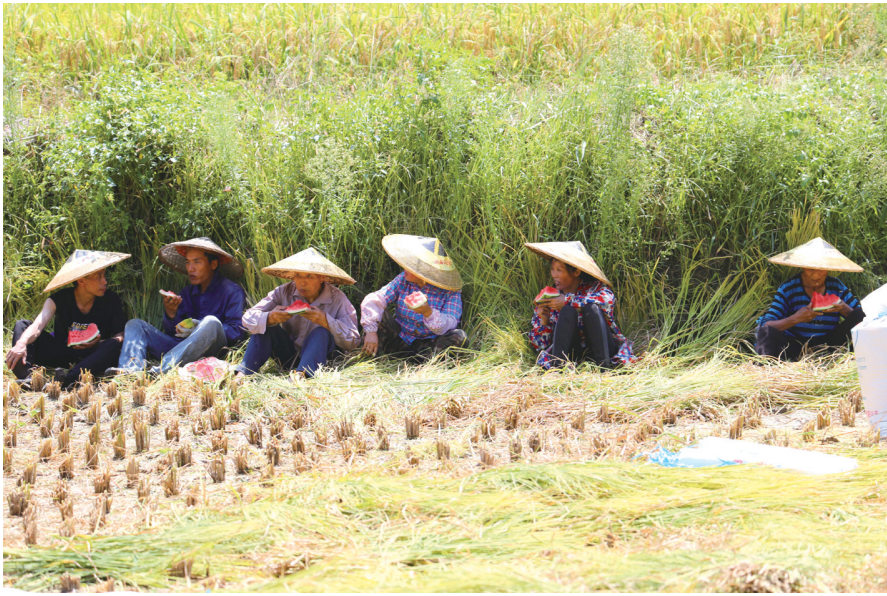
8月28日，吉首市乾州街道西门口村，村民在稻田中休息。