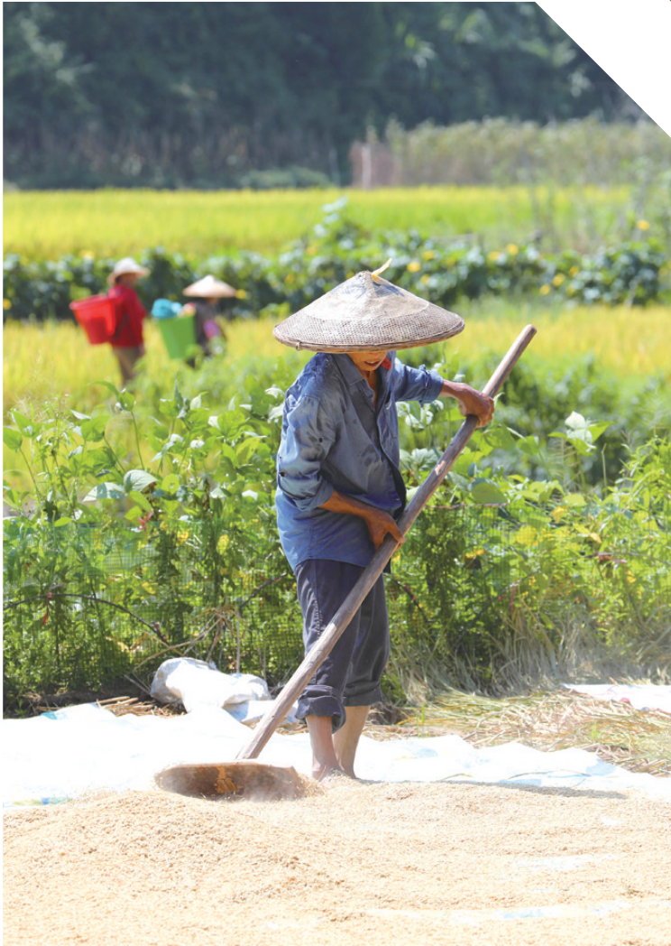
8月28日，吉首市乾州街道西门口村，村民在晾晒稻谷。