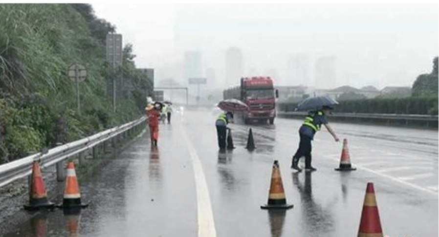
张家界高速慈利段边坡有山体滑坡现象，慈利路政大队队员在路上摆放安全锥桶做安全警示工作。