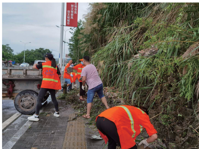
市城区滨河路路段雨后山体滑坡堵塞人行道，环卫工人忙清理。