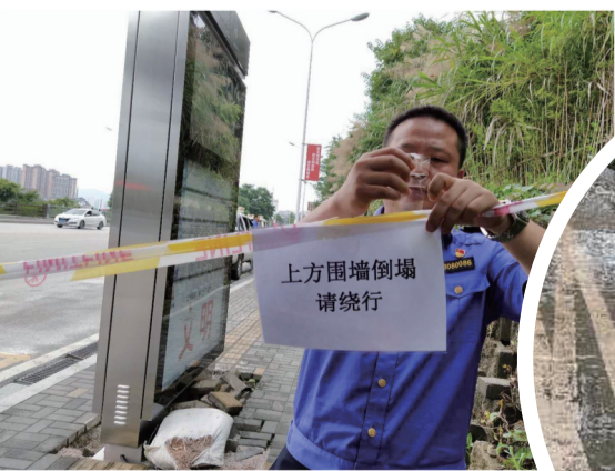
市城管局执法人员在山体滑坡路段设置安全警戒线和安全警戒标语