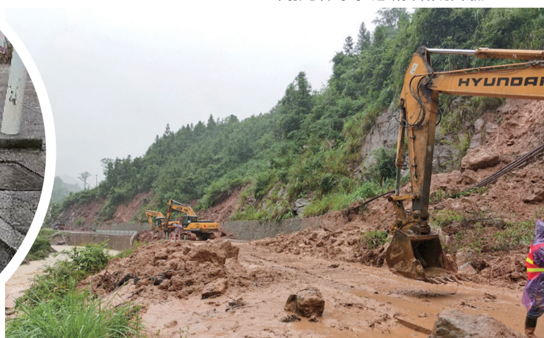
永定区教温公路滑坡灾毁严重，图为市交通局保通抢险现场