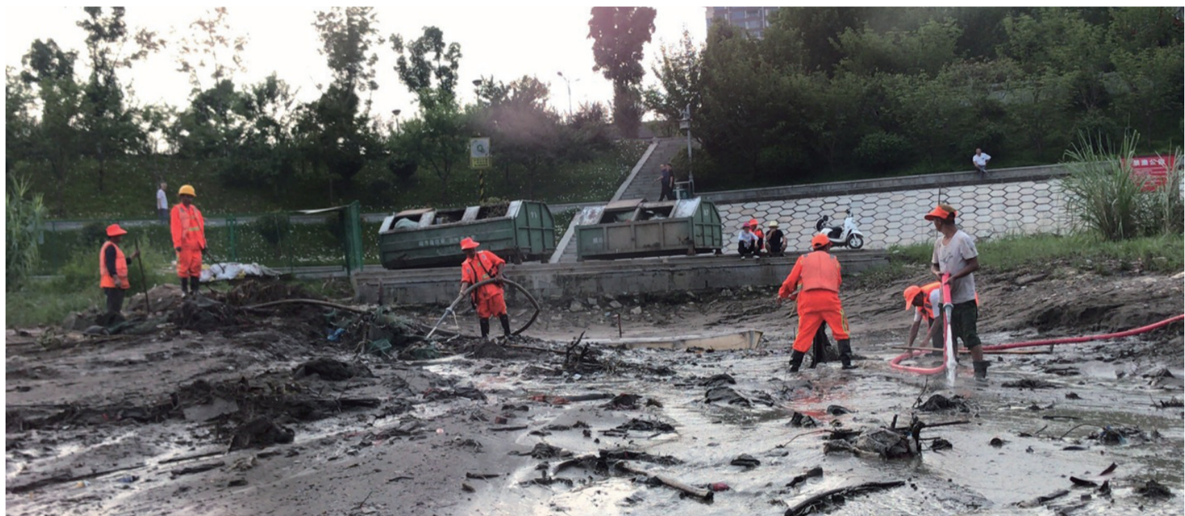
环卫工人清淤现场。