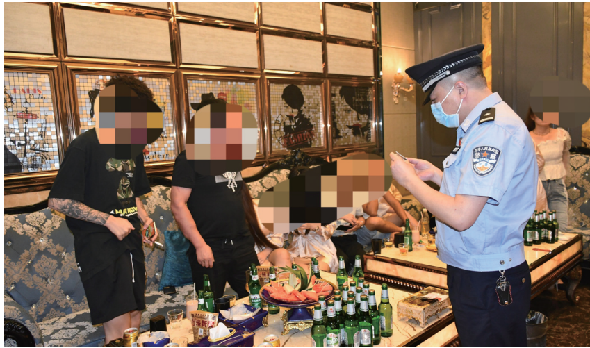
区公安分局突击检查娱乐场所