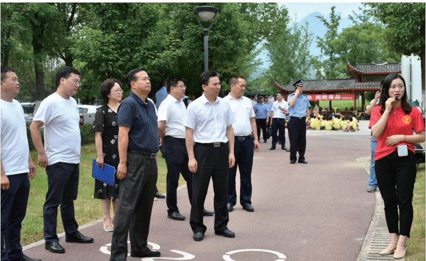
市区领导调研永定区禁毒主题公园建设