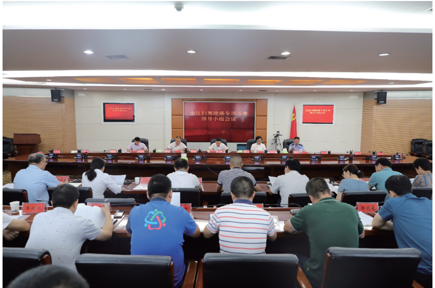
2020年7月2日永定区召开扫黑除恶专项行动领导小组会议