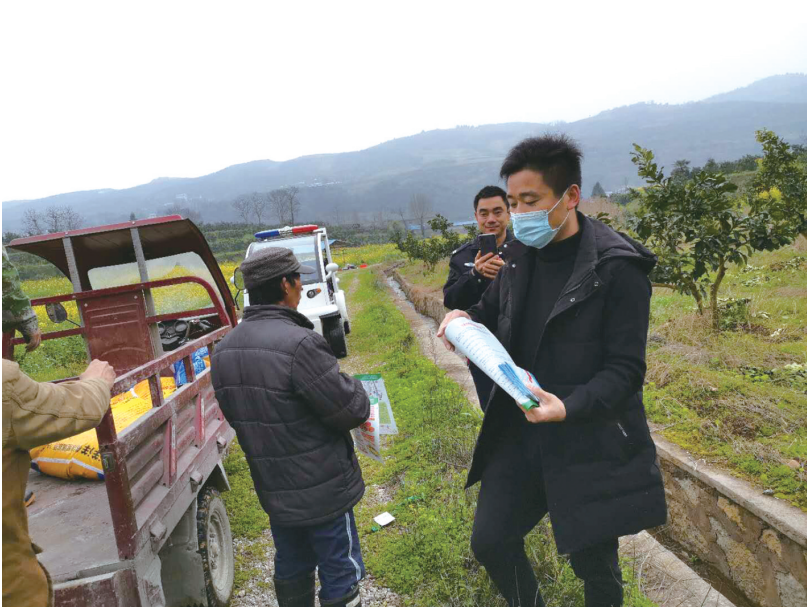
乡镇街道禁毒专干开展走访帮教工作