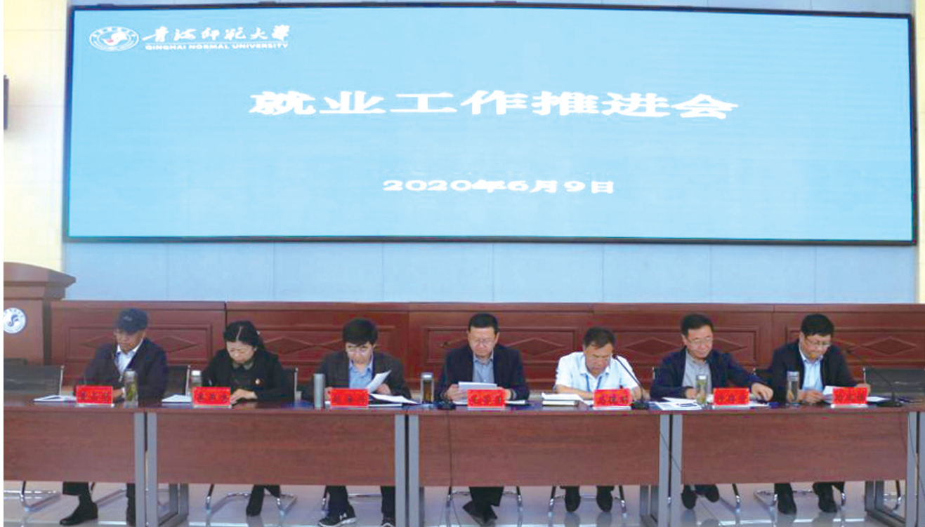
青海师范大学召开就业工作推进会，研究毕业生就业工作（6月9日摄）。