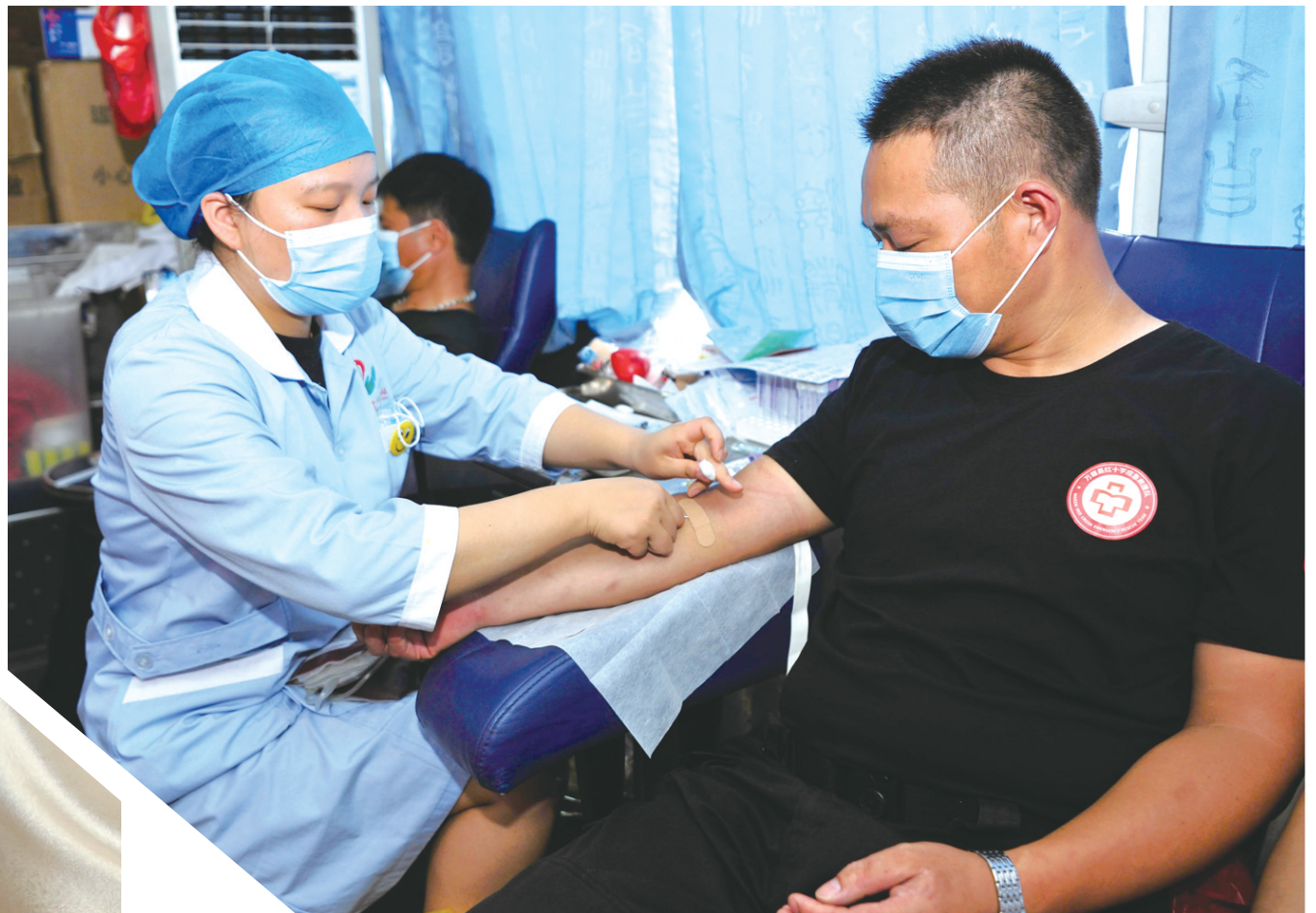
6月14日，江西省宜春市万载县市民在献血车上献血。