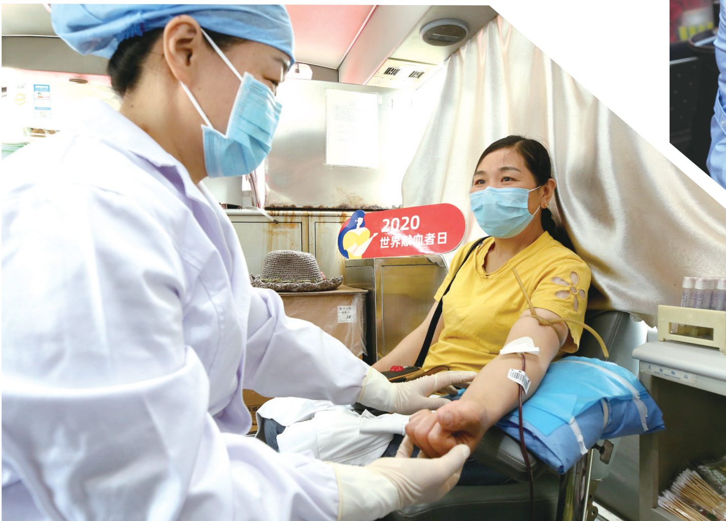
6月14日，市民在山东省枣庄市光明广场采血车上献血。