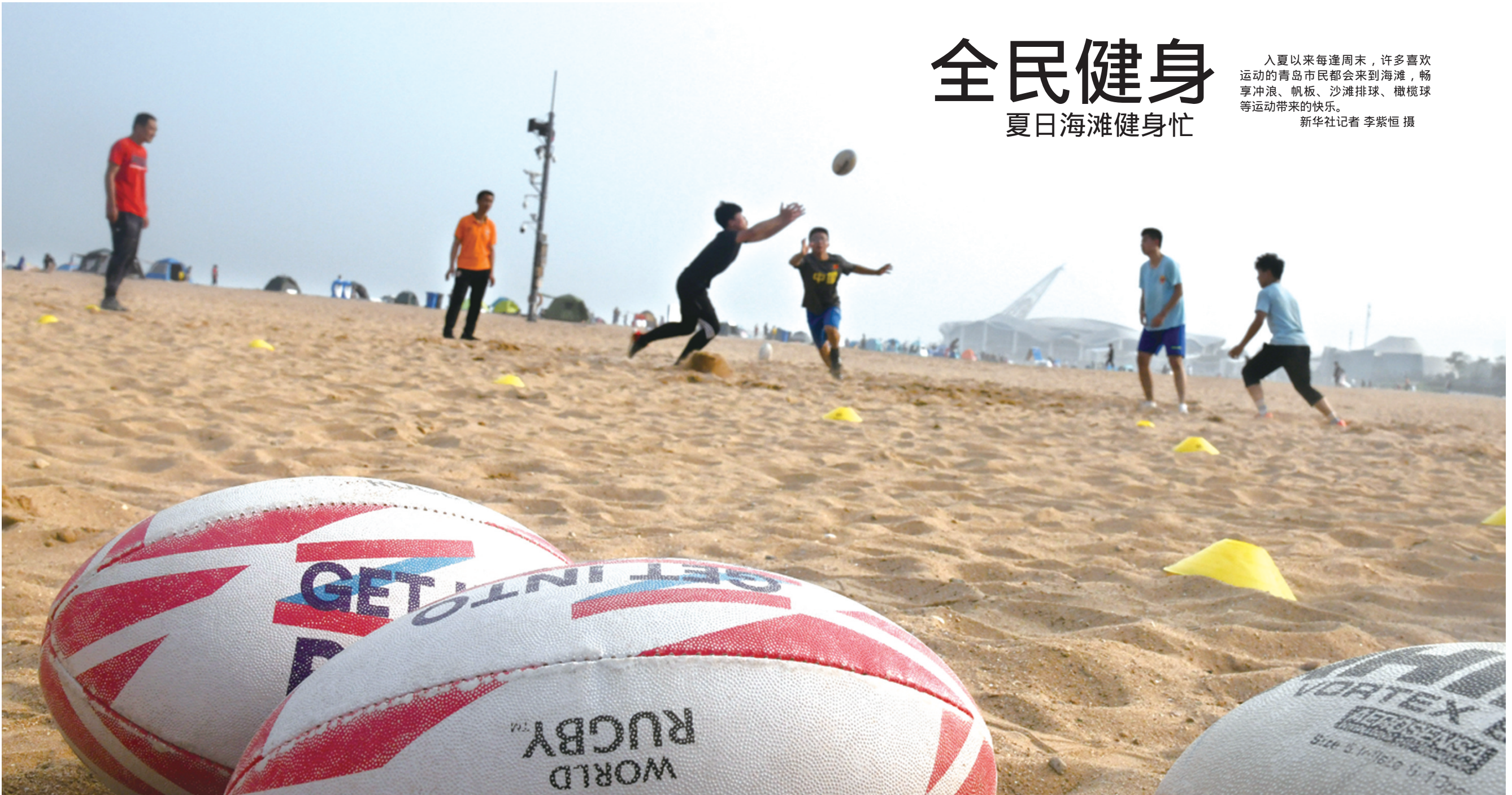
6月14日，市民在青岛石老人海水浴场打橄榄球。

入夏以来每逢周末，许多喜欢运动的青岛市民都会来到海滩，畅享冲浪、帆板、沙滩排球、橄榄球等运动带来的快乐。