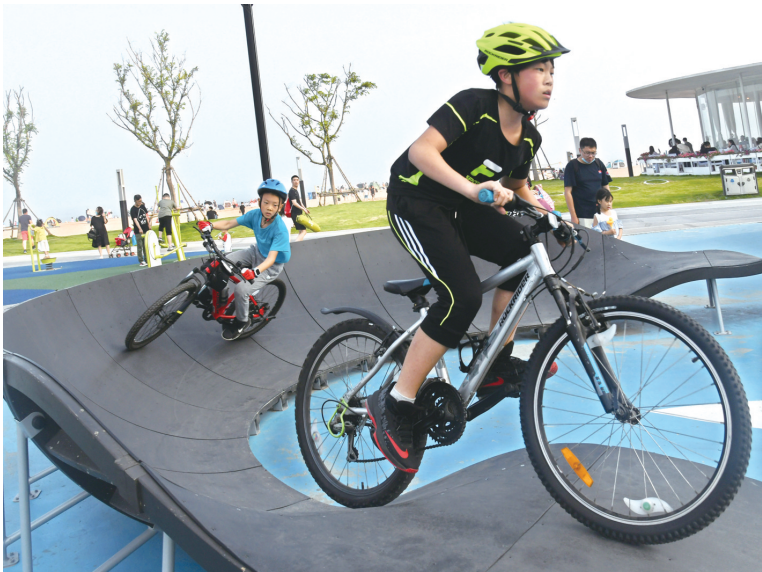
6月14日，两个男孩在青岛石老人海水浴场小轮车竞技场练习。