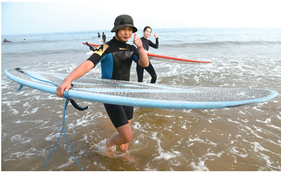
6月14日，两名冲浪爱好者来到青岛石老人海水浴场练习。