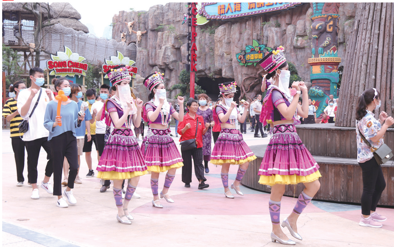
6月12日，张家界千古情景区恢复开放首日，从14点15分至22点30分，景区除了在剧场上演三台《张家界千古情》演艺节目，还在大庸古街、千古情广场、彩楼广场等地间插表演《市井走街》《民族迎宾巡游+摆手篝火狂欢》《江湖快闪秀》《向将军点兵》《土司招婿》等游客互动节目，吸引近两千名游客进入景区。

►6月9日上午，中共张家界市张家界市旅游协会旅行社分会党支部 成立大会 在市文旅广体局五楼会议室召开，会上选举产生了第一届支部委员会。