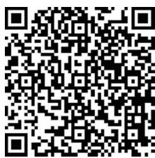
扫码了解方案详情