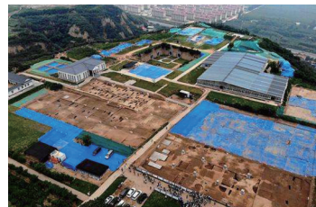
河洛文化生态保护实验区

►近日，农业农村部、国家发展和改革委员会同规划实施协调推进机制27个成员单位编写的《乡村振兴战略规划实施报告（2018—2019年）》出版发布。《报告》显示，两年来，《乡村振兴战略规划（2018—2022年）》实施稳步推进，各方面重点任务取得显著成效，乡村振兴实现 良好开局 。