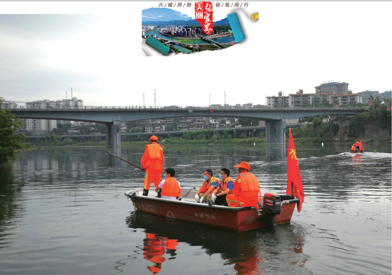
↑志愿者在澧水河城区段清理两岸的垃圾、福寿螺和螺卵等。

黄辉不仅自己挣钱，他还带领周边的老百姓一起致富。他说：赤子从来亲故土，丹心何必许天涯。我能带领周边的乡邻们都富起来，这就是最大的成功。每年，黄辉的公司通过土地流转、