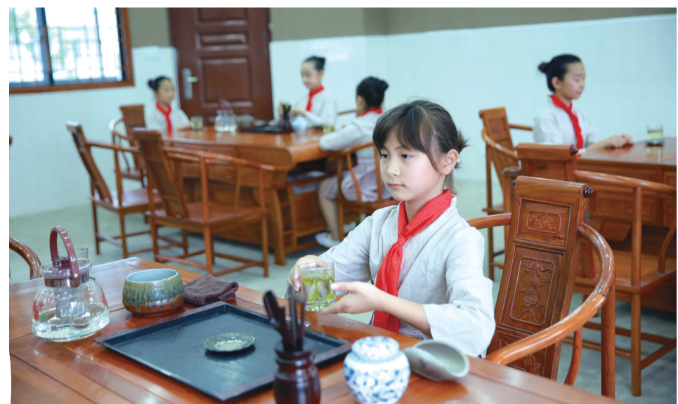
5月21日，浙江省东阳市新村小学茶艺室内，学生们在学习茶文化。