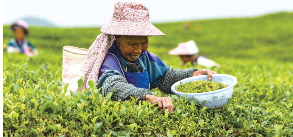
5月21日，贵州省安顺市西秀区双堡镇茶农在茶园采摘茶叶。