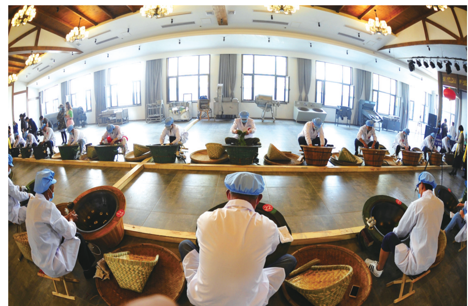
5月21日，数十名茶农在青岛市茶文化节上进行炒茶比赛。