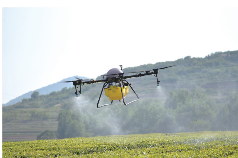
5月21日，在山东省日照市东港区后村镇石桥官庄村茶园，植保无人机在茶园作业。

纪检监察干部要做群众的“贴心人”，就是要多深入田间地头，察民情、解民忧、帮民困。今后，我们会经常性地开展志愿服务活动，为老百姓解决确实困难的困难。该区纪委监委、机关党支部书记赵韩英说。