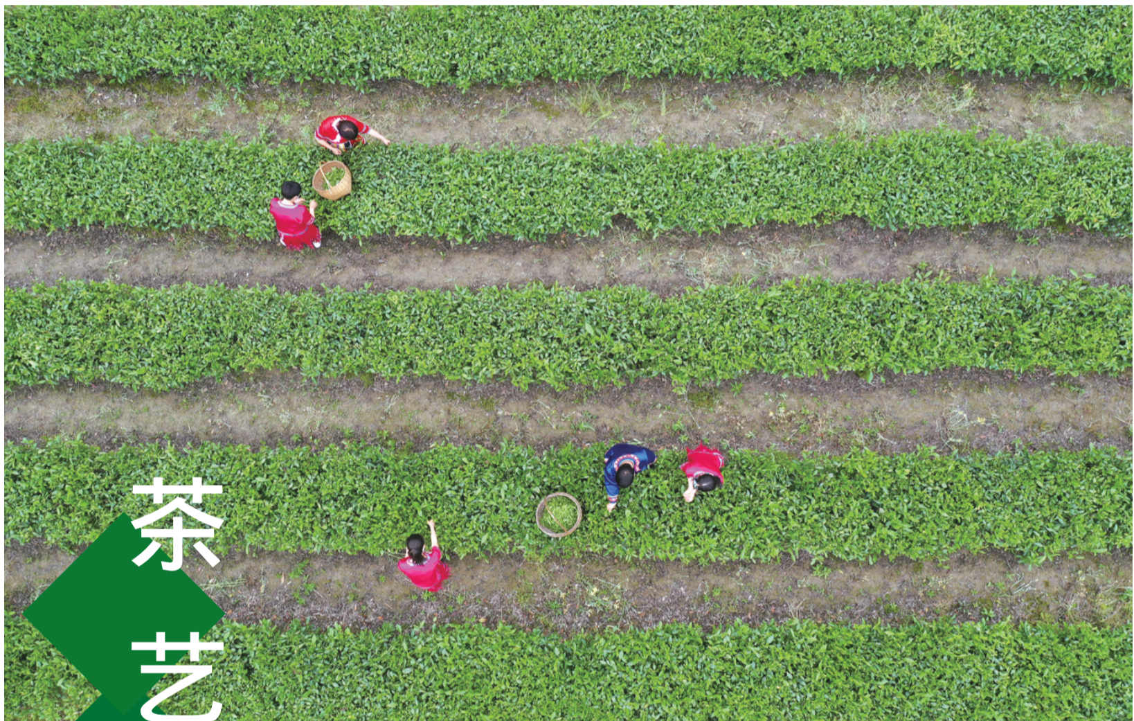
5月21日，在湖北省宜昌市长阳土家族自治县贺家坪镇青岗坪村，茶农在茶园采茶(无人机照片)。