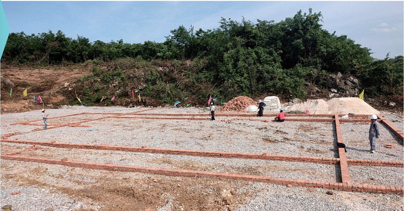
5月12日，慈利县龙潭河镇金富村，东方希望畜牧有限公司现代化生猪养殖循环产业基地项目平整土地现场。

春节前后，在市场上买肉，猪肉价格每公斤七十多元，感觉好贵，吃不起。本以为猪肉价格自此会一骑绝尘，破百而去，不曾想各级政府一套保供稳物价的组合拳下来，猪肉价格十一周连降，很快回到百姓心中预期。敬请关注本期主题： 生猪生产和猪肉价格走势 策 划：经济部