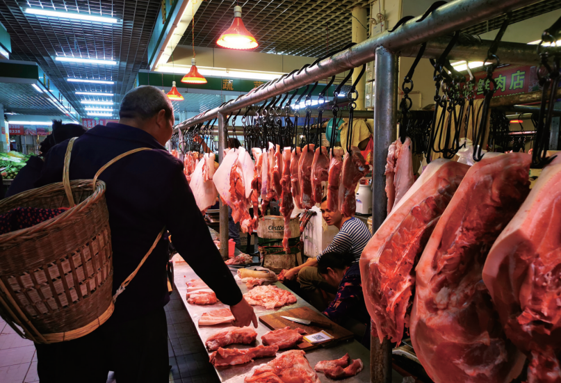
市城区新风市场，前来购买的客人在询问猪肉价格。