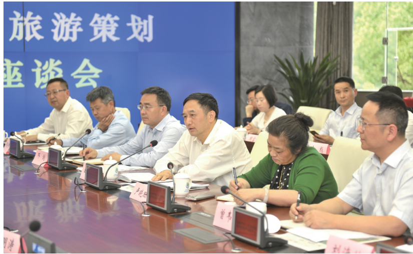
茅岩河心湖旅游策划暨西线旅游营销座谈会现场。