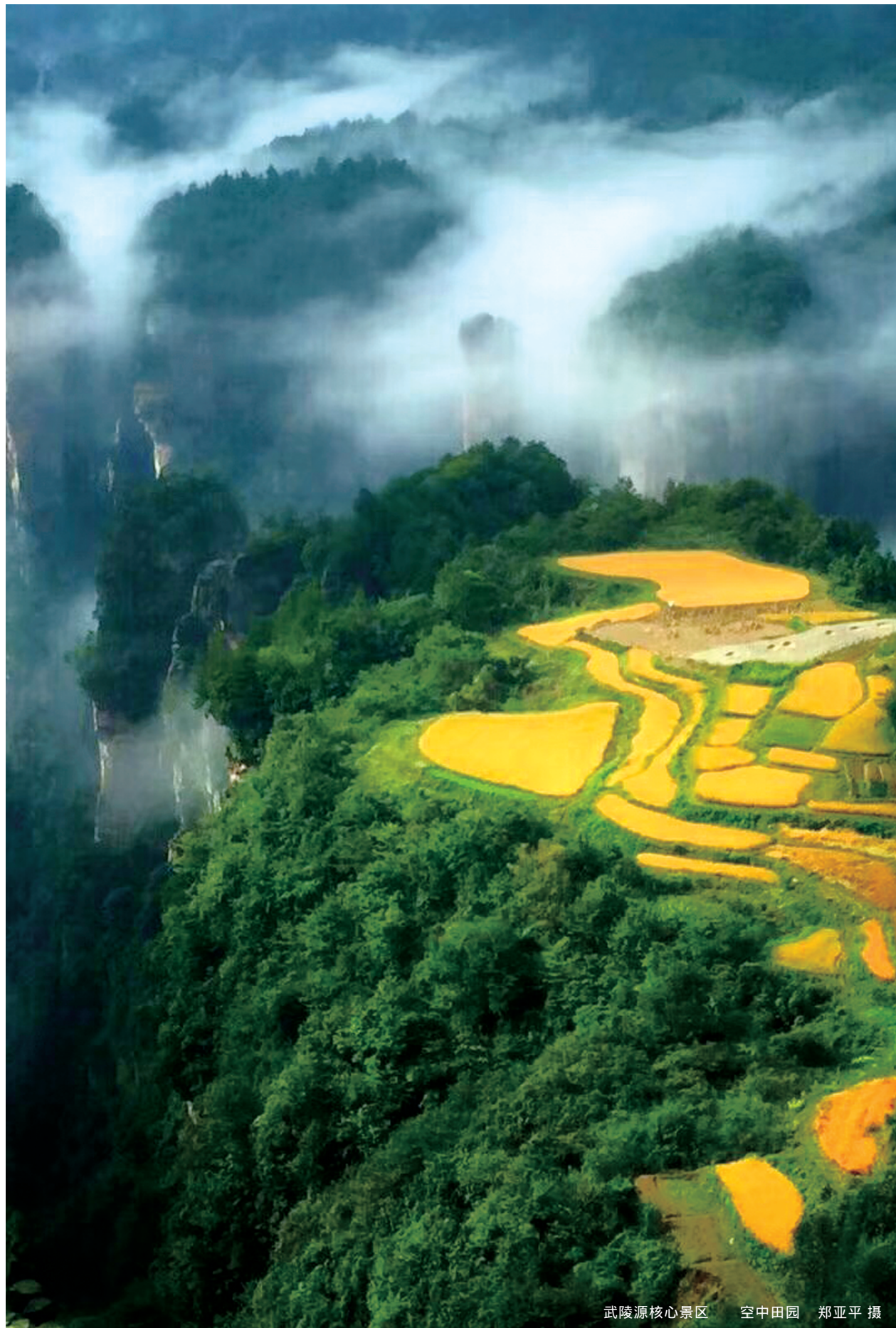
武陵源核心景区 空中田园

4月29日，尼尔森网联发布2020年张家界城市发展NCDI指数。以空气质量闻名于世的张家界成为各项指标的优等生，其城市宜居指数高居首位！来吧，到张家界来一场养心洗肺之旅！