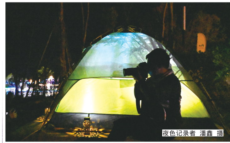
夜色记录者