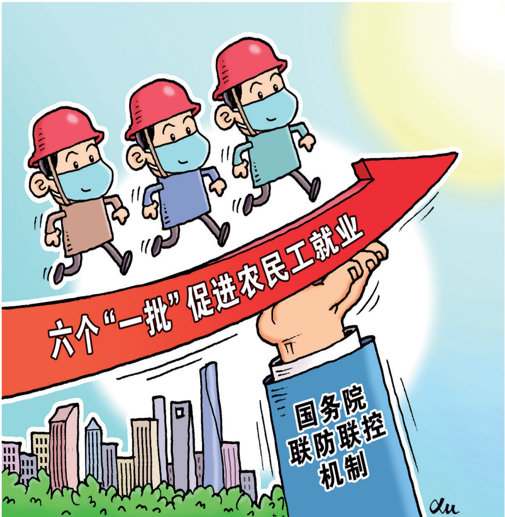
在2月28日举行的国务院联防联控机制新闻发布会上，人力资源社会保障部副部长游钧说，总体看，此次疫情对农民工就业的影响比较大。在做好疫情防控的前提下，将通过六个“一批”来促进农民工就业。

就业是最大的民生。在日前召开的统筹推进新冠肺炎疫情防控和经济社会发展工作部署会议上，习近平总书记强调，全面强化稳就业举措。要实施好就业优先政策，根据就业形势变化调整政策力度，减负、稳岗、扩就业并举。