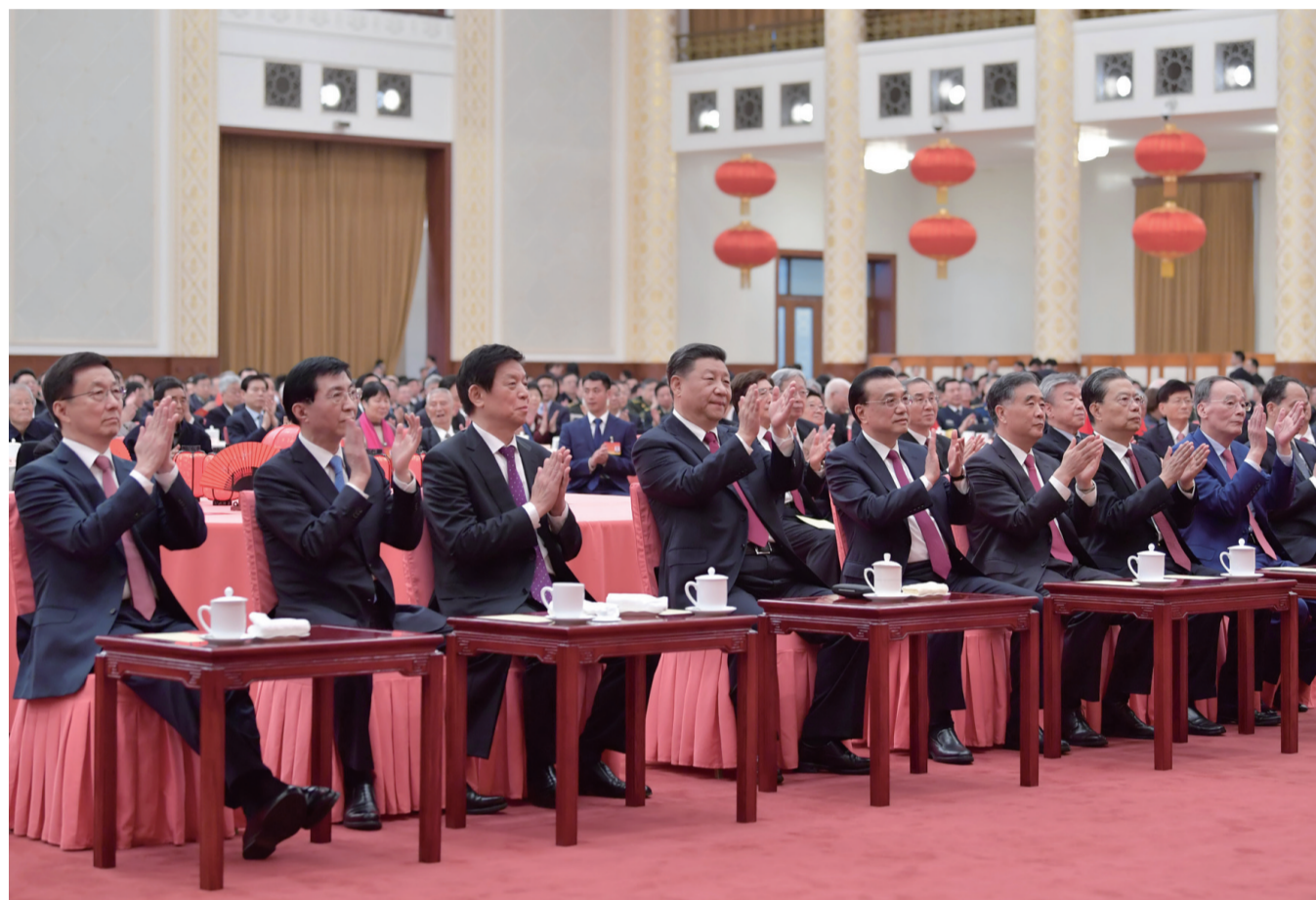
1月23日，中共中央、国务院在北京人民大会堂举行2020年春节团拜会。党和国家领导人习近平、李克强、栗战书、汪洋、王沪宁、赵乐际、韩正、王岐山等同首都各界人士欢聚一堂，共迎新春。

新华社北京1月23日电 中共中央、国务院23日上午在人民大会堂举行2020年春节团拜会。中共中央总书记、国家主席、中央军委主席习近平发表讲话，代表党中央、国务院，向全国各族人民，向香港特别行政区同胞、澳门特别行政区同胞、台湾同胞和海外侨胞拜年。