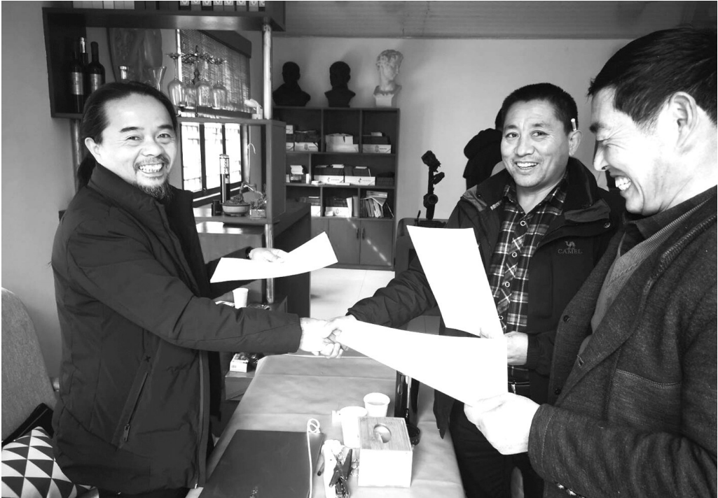
▲熊风公司负责人（左一）与双文村、双星村负责人签订投资入股协议。