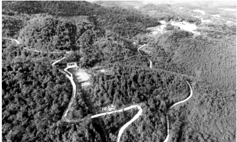
绿色怀抱的云朝村。

慈利县龙潭河镇云朝村。海拔平均550米，版图面积12880亩，耕地面积1067亩，全村238户800人，其中党员37人，建档立卡贫困户58户203人，有8个村民小组。云朝村在村支两委的带领下，村容村貌都在发生变化。