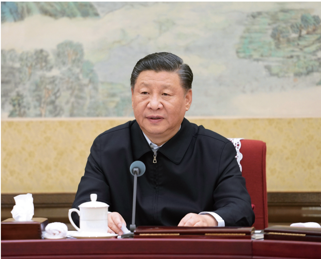
12月26日至27日，中共中央政治局召开不忘初心、牢记使命专题民主生活会，中共中央总书记习近平主持会议并发表重要讲话。