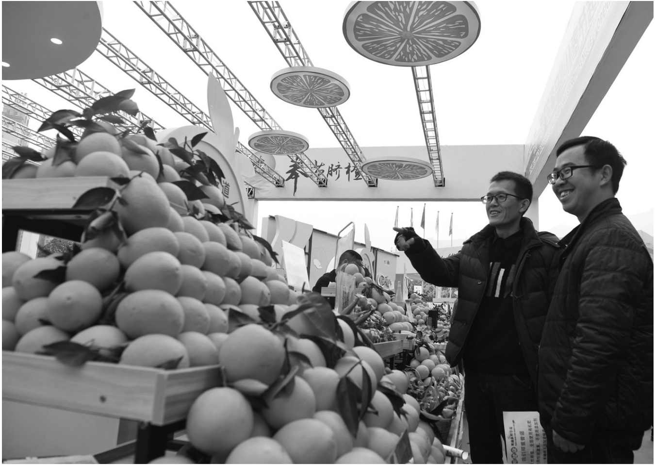
12月15日，观众在重庆奉节国际橙博会上选购脐橙。 当日，首届中国 重庆奉节国际橙博会开幕式暨2019年度奉节脐橙开园仪式在奉节滨河公园广场举行。本届橙博会展历时两天，将举行消费扶贫暨新零售产销对接会、社交电商助力脱贫攻坚重庆行 奉节脐橙专场等多项活动。 近年来，奉节县大力发展脐橙产业，2019年，奉节脐橙种植面积达33.5万亩，预计产量33万吨，产值超30亿元。

近日，笔者来到武陵源区中湖乡石家峪村，看到整洁的水泥路面、干净的农家庭院，过去垃圾围村，臭气熏天的情况彻底改观。 在 不忘初心、牢记使命 主题教育中，针对群众反映的农村垃圾乱倒、农户庭院脏乱差等一系列突出问题，武陵源区坚持问题导向，大力整治农村人居环境，建设美丽乡村。积极实施 人居美、环境美、生态美、乡风美 农村人居环境整治四大行动，实行乡对村、村对组、组对户三级考核制度和层级管理制度，通过订立民约、评优罚劣，进一步凝心聚力，形成了 区里统筹指导、乡街道主抓主导、联系单位同管同治、村居具体落实、群众全面参与 的工作机制，初步建成 一户一处景，一村一幅画、一线一风景 的美丽乡村。 农村人居环境整治是实现乡村振兴的第一场硬仗。武陵源区紧盯农村人居环境整治这条主线，农村人居环境得到持续提升，城乡面貌发生显著变化。突出农村生活垃圾处理，按照 分类投放、分类收集、分类运输和分类处置 的要求，大力推进农村垃圾分类工作。先在石家峪等8个村开展试点，完善垃圾分类基础设施，设置垃圾分类体验点，构建 户分类、村分拣收集、乡镇（街道）处置 体系。目前，该区家家户户配备了垃圾（箱、桶），乡镇（街道）共建垃圾池（箱、桶）800多个、垃圾中转站15个，购置垃圾清运车辆30余台。 户分类、村收集、乡（街道）转运、区处理 的垃圾收集处理模式实现全覆盖，垃圾分类减量工作有序推进；突出农村生活污水治理，扎实推进河长制，建成并投入运营4个污水处理厂，全面推广应用 4池湿地污水处理系统，农村生活污水处理率达82%，饮用水水质达标率达100%，安全饮水实现全覆盖；突出农村 厕所革命，通过改水、改旱以及建设花园式微生物处理池，将水源和污水处理问题一并解决，完成农村厕所改造200多户；突出村容村貌改善，严格农村建房审批，扎实推行房屋本土化、民俗化风貌改造，完成民居风貌改造939户，协合乡杨家坪村、天子山街道湖南峪社区等民族风格建筑成为一道亮丽风景线。 同时，在推进人居环境综合整治的过程中，武陵源区坚持做到了 四个注重。注重规划引领，编制了乡村振兴战略实施规划、村庄规划，做好与法律法规、风景名胜区总规等各项规划的有机衔接，明确建设范围，做好产业布局，做到不碰红线、不越底线，既保证了人居环境整治的总体推进，又降低了环境污染等风险隐患；注重资源盘活，通过多种形式盘活农民闲置宅基地、闲置农房，引导农民以产权入股、租赁、托管等方式与社会资本合作经营，打造了五号山谷、回家的孩子、梓山漫居等一批特色民宿品牌，有效提升和改善了农村房屋风貌、居住环境；注重共建共享，结合新时代文明实践活，广泛开展美丽庭院、清洁家庭等评比，对户用厕所改造、小型污水处理等设施建设实行农户适当出资、政府给予奖补，鼓励群众投工投劳，充分激发全民参与人居环境整治的积极性，实现共建共享；注重多元投入。将区财政每年收入增长的20%用于美丽乡村建设，整合涉农、发改、环保、住建、水利等资金用于农村人居环境整治，配套建设好农村水电路气等基础设施，撬动社会和民间资金投入，对污水、垃圾等实行特许经营，通过政府主导、市场主体全面加大对农村人居环境整治的投入保障。