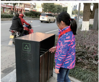
随手捡拾垃圾,做文明好少年。