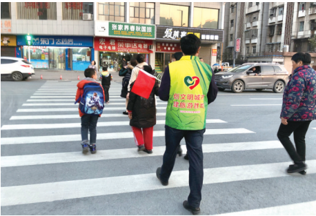
▲身穿荧光马甲的义警在街头巡逻,助力文明城市创建工作。