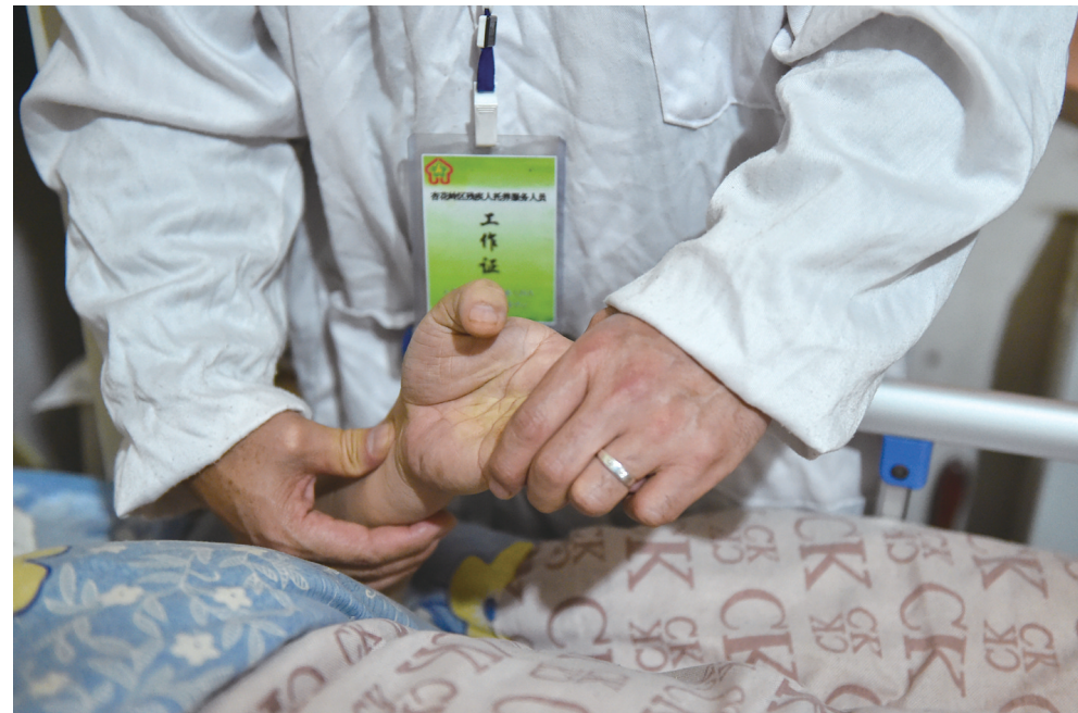
11月29日，阳光托养计划项目的医护人员为残疾人进行身体理疗。