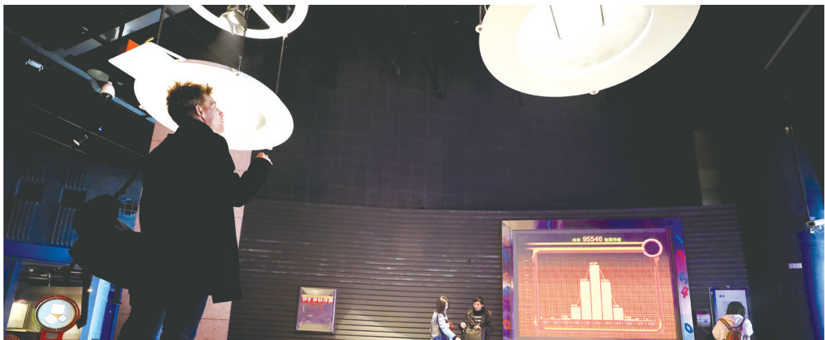
12月3日，参观者在观察一个名为“波的干涉”的实验装置。