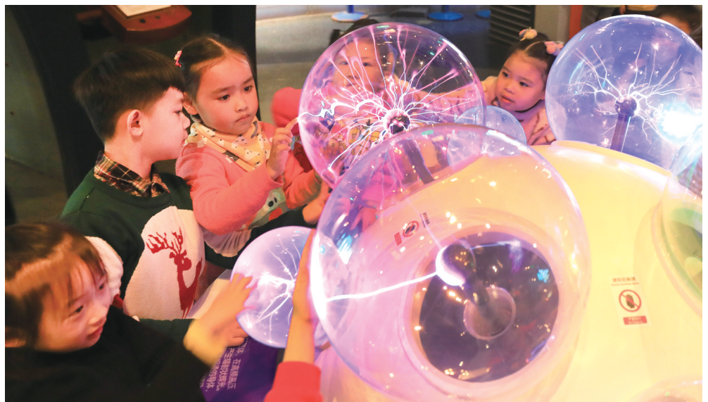
12月3日，小朋友与一组辉光球展品互动。

近日，一批新展品陆续亮相上海科技馆，涉及物理学、数学等科学内容，互动探索体验让身其中的大朋友和小朋友们流连忘返。