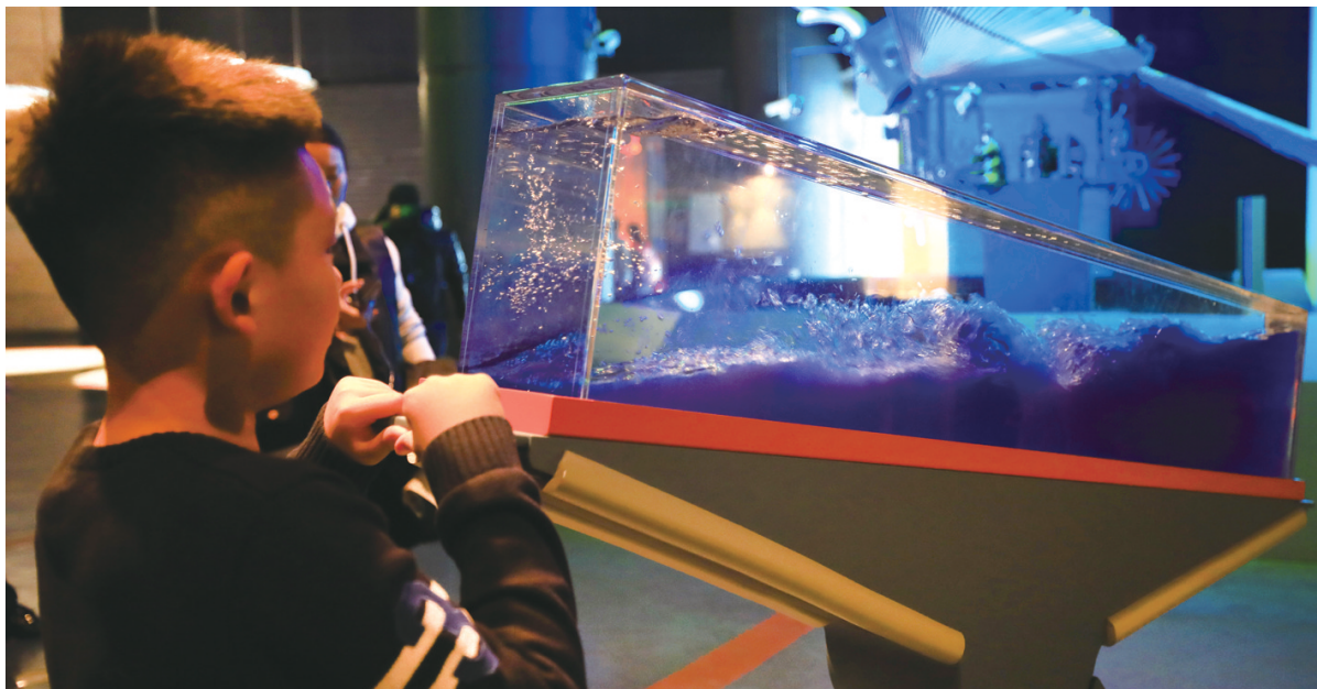
12月3日，小朋友在操作体验一个实验装置。