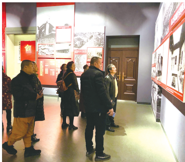
11月29日，来自广铁集团的参观团在桑植红二方面军长征出发地纪念馆参观文物展，倾听革命故事，感受红军长征精神。