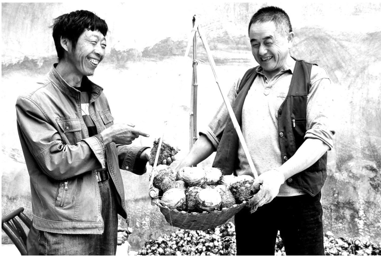
我家的芋头不再愁销了 老农唐阶村端着芋头是喜上眉梢